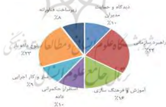
شکل ۴. فراوانی مقوله‌های مربوط به پدیده اصلی

(۱) راهبرد سازمانی؛ شامل: مرتبطسازی داده باز با شفافیت در سازمان، مرتبطسازی داده باز با بهبود روند مدیریت، مرتبط سازی داده باز با بهبود انجام کارها، سنجیدن با سازمان‌های