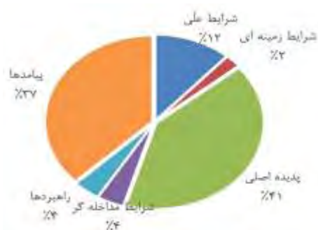
شکل ۷. فراوانی شرایط و عوامل براساس مدل مفهومی پیشنهادی پژوهش Figure 7. The Frequency of Conditions and Factors Based on the Proposed Conceptual Model of the Research

در این پژوهش، برای شناسایی عوامل مؤثر بر شکل‌گیری نوآوری مبتنی بر داده‌های باز دولتی، دیدگاه پژوهشگر به سازمان‌های دولتی و عمومی محدود شد؛ صرفاً عوامل مؤثر بر سازمان‌های دولتی و عمومی بررسی شدند؛ مصاحبه با گروه‌هایی که انجام شد؛ (۱) سیاست‌گذار و مجری در حوزه داده باز بوده‌اند؛ (۲) درگیر در پروژه‌های داده باز بوده‌اند (شهرداری تهران)، (۳) خبرگان دانشگاهی و مشاوران حرفه‌ای بوده‌اند؛ (اذعان می‌دارد که مصاحبه‌شوندگان، افراد کاملی نبوده‌اند و محدود به گروهی خاص نبوده‌اند). در پژوهش جاری از دیدگاه استارت‌آپ‌ها و کسب‌وکارهای خصوصی، نوآوران، همچنین مردم به موضوع زمینه‌های ایجاد نوآوری از داده‌های دولتی باز پرداخته نشده است. بالطبع مصاحبه با این گروه‌ها نتایج دیگری را در بر خواهد داشت. پیشنهاد می‌شود در پژوهش‌های آتی به موضوع زمینه‌های ایجاد نوآوری از داده‌های دولتی باز از دیدگاه گروه‌های دیگر نظیر نوآوران، مردم، استارت‌آپ‌ها و کسب‌وکارهای خصوصی پرداخته شود.