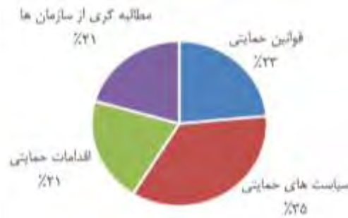
شکل ۲. فراوانی مقوله‌های مربوط به شرایط علی معطوف به «پیشران‌های مؤثر برون‌سازمانی در شکل‌گیری نوآوری مبتنی بر داده‌های دولتی باز»

علی که در اینجا معطوف به پیشران‌های مؤثر برون‌سازمانی است در قالب مقوله‌های فرعی به ترتیب زیر است: (۱) سیاست‌های حمایتی؛ شامل: سیاست‌های کاهش مداخله دولت، ارزیابی عملکرد سازمان‌ها، حمایت مدیران عالی کشور، الزام سازمان‌ها، تقارن دسترسی کارکنان دولتی و کسب‌وکارهای خصوصی به داده‌ها