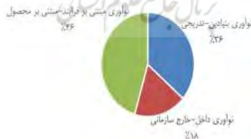
شکل ۵. فراوانی مقوله‌های مربوط به راهبردها

۱) قابلیت همکاری با بخش خصوصی؛ شامل: استفاده از ظرفیت بخش خصوصی در قالب مشارکت عمومی-خصوصی، استفاده از ظرفیت بخش خصوصی، حمایت از مراکز نوآوری، تسهیل و مقررات زدایی از قوانین سازمانی.