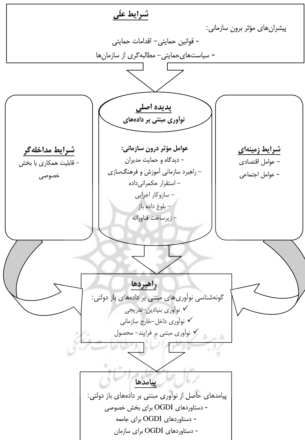
شکل ۱. ارائه مدل پیشنهادی برای نوآوری مبتنی بر داده‌های دولتی باز با استفاده از نظریه داده‌بنیاد