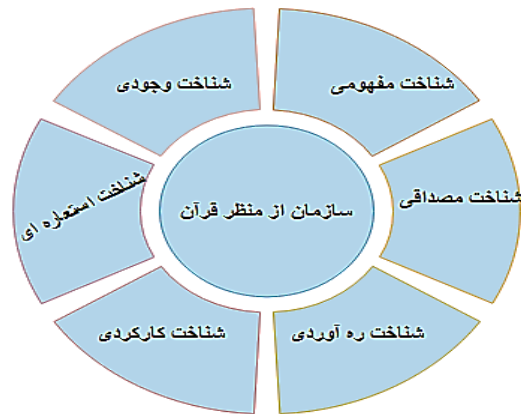
شکل شماره 1: انواع شناخت سازمان