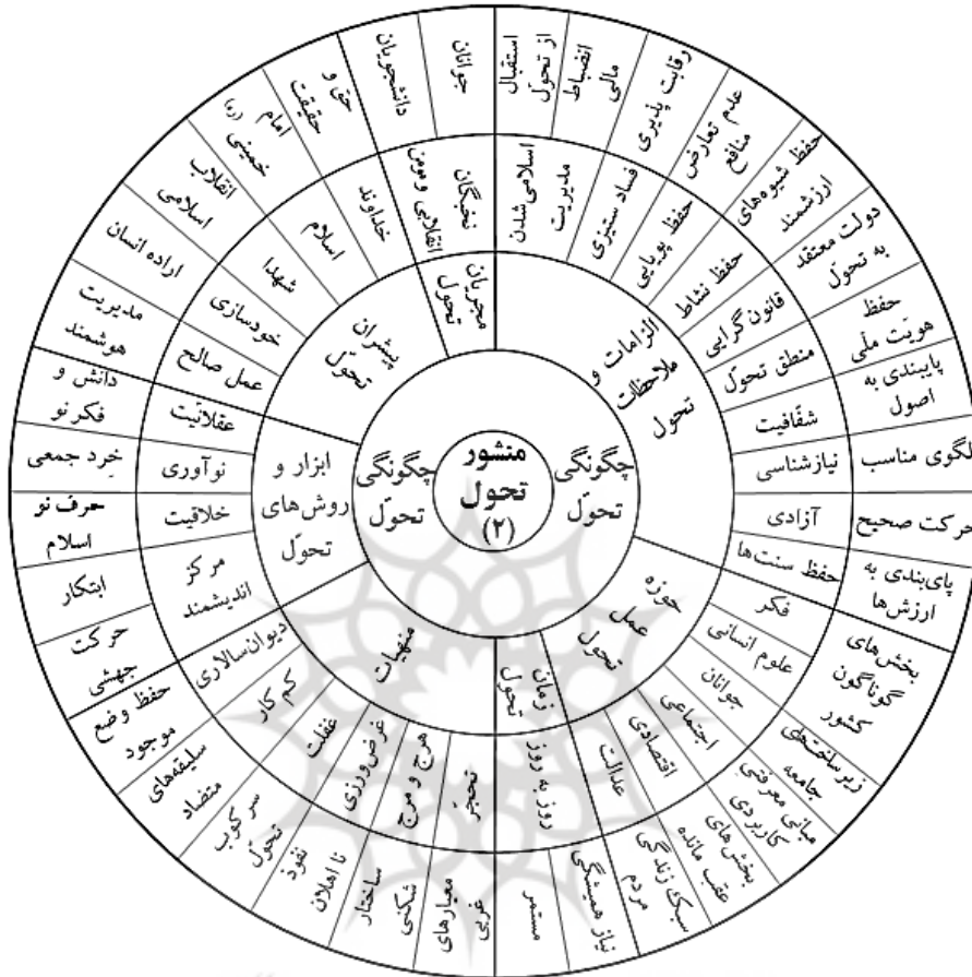
نمودار شماره ۲ شبکه مضمون فراگیر چگونگی تحول در جمهوری اسلامی ایران از منظر حضرت امام خامنه‌ای (مدظله العالی)