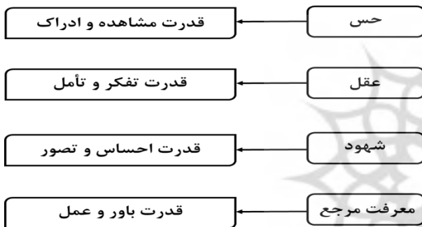
شکل ۲. منابع معرفتی انسان

تصمیم‌سازی هاست. اگر معرفت مرجع چنین رسالتی را عهده‌دار نباشد، نقش ایدئولوژی یا پندار بیهوده ۲ را خواهد داشت. این چنین، همان‌گونه که ملاحظه می‌شود، با چهار منبع معرفتی «حس»، «عقل»، «شهود» و «معرفت مرجع» مواجه می‌باشیم که هرچند دقت نظر در هر یک و واگشایی آن براساس مختصات اصلی اش به طراحی نمودار ارائه شده در قالب شکل ۲ می‌انجامد و ما را به مقصودمان نزدیک‌تر می‌کند؛ اما آنچه که پیش‌نیاز یا پیش‌شرط اصلی تأمین این مقصود به‌شمار می‌آید همانا ارائه صورت‌بندی «ساختار معرفت‌شناختی انسان» می‌باشد. با هدف ارائه این صورت‌بندی بوده است که شکل شماره ۳ طراحی شده است.