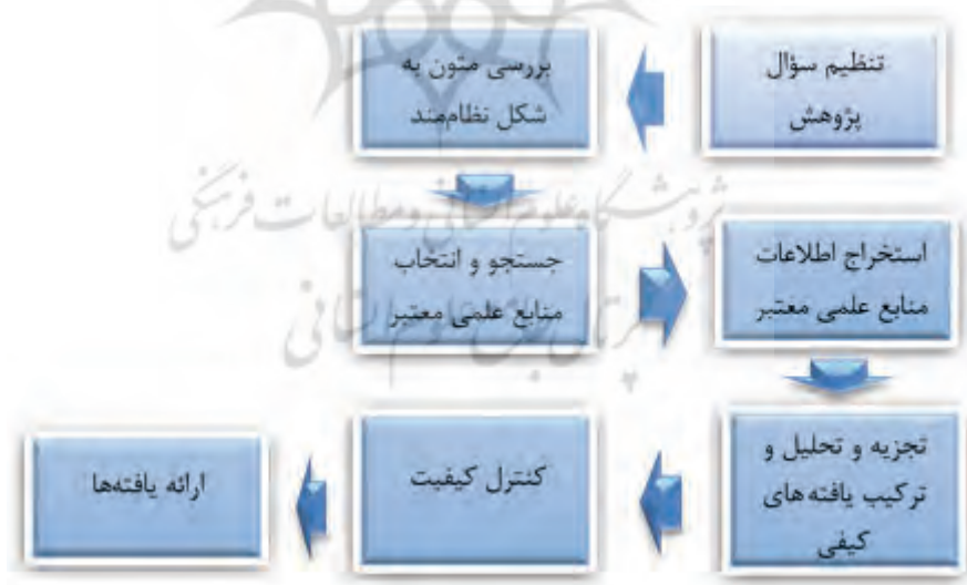
شکل ۱. گام‌های روش فراترکیب

MAXQDA انجام شده است. فراترکیب از طریق فراهم کردن نگرش نظام‌مند برای پژوهشگران از راه ترکیب پژوهش‌های کیفی مختلف، موضوع‌ها و استعاره‌های جدید و اساسی را کشف می‌کند و با این روش دانش جاری را ارتقا می‌دهد و دیدی جامع و گسترده در زمینه مسائل پدید می‌آورد (زنگنه‌نژاد، حاجی حیدری و آذر، ۱۴۰۰: ۱۰۳)؛ در واقع ترکیب تفسیر داده‌ها و یافته‌های اصلی مطالعات منتخب است. فراترکیب عصاره‌ای از تفسیرهای مطالعات پیشین نیست، بلکه یکپارچه‌سازی تفسیر یافته‌های اصلی مطالعات منتخب به‌منظور ایجاد یافته‌های جامع و تفسیری است که حاکی از فهم عمیق محقق در این خصوص است (Zimmer, 2006: 312-313). در این پژوهش از فرایند هفت مرحله‌ای ساندلوسکی و بروسو (۲۰۰۷) برای انجام فراترکیب استفاده شده است.