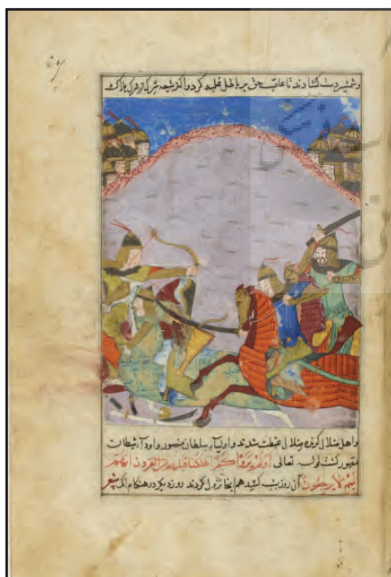
ب) خطوط اصلی ساختار

جمع بندی تحلیل شمایی: انحنای موجود در سر و بدن فیگورها، به همراه قرارگیری آنها در یک فضای میزگرد مانند، تداعی‌کننده حسی از تعظیم، احترام و صبوری است. نگارگر، با نمایاندن نیمی از بدن فیگورها بر شمایل‌های اصلی، یعنی سفیر و شاه تاکید کرده است. دیدار شاه با سفیر در فضایی بیرون از مقر اصلی پادشاه، از رسمیت این ملاقات کاسته و وجود تعداد کمی از همراهان، نشان از فضای امن یا محرمانگی این ملاقات دارد.