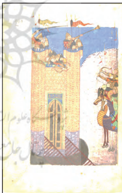
شکل ۶. الف) هلاکو و مغولان الموت

نگاره هلاکو و مغولان الموت را محاصره می‌کنند. محاصره قلعه اسماعیلیان در الموت، اندکی قبل از این‌که به دست سپاهیان هلاکو ویران شود. این نگاره در ابعاد ۱۲۴ در ۲۱۳ میلی‌متر و در صفحه ۱۴۹ نسخه قرار دارد. از منظر تجسمی، اصلی‌ترین خطوط در ساختار به صورت عمودی، مورب و منحنی استفاده شده‌اند. تصویر دارای خطوط کناره‌نما، اشکال دوبعدی و مسطح است که القای کم‌عمق