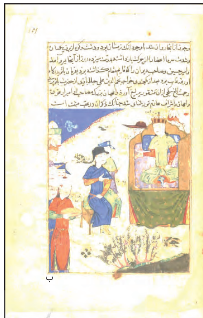
ب) خطوط اصلی ساختار ترسیم خطوط اصلی بر اساس بیشترین نقطه بصری بر روی یک محور انجام شده است.