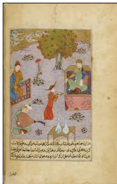
شکل ۵. الف) جلوس کویوک هان