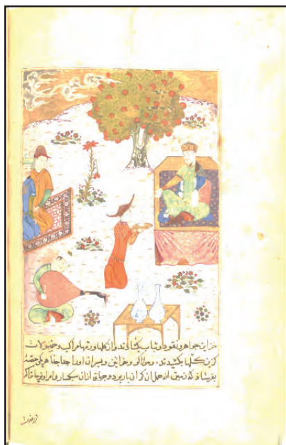
ب) خطوط اصلی ساختار

نگاره جلوس کویوک هان (کویوک هان قبل از این که خزانه خود را برای توزیع باز کند، در حومه مهمانی می دهد). این نگاره در اندازه ۱۱۷ در ۱۶۴ میلی متر و در صفحه ۱۴۰ نسخه قرار دارد. از منظر تجسمی، اصلی ترین خطوط در ساختار، به صورت عمودی، افقی و مورب استفاده شده است. تصویر دارای خطوط کناره نما، اشکال دوبعدی و مسطح است که القای عمق کم با هم پوشانی اشکال نمایش داده شده است. در این تصویر، بافت انتزاعی و شبیه سازی شده است و رنگ بندی به کار رفته، رنگ های خانواده گرم و سرد با غلبه ثنائیته کرم تا قهوه ای است. رنگ ها به صورت تخت و کنتراست، با استفاده از رنگ مکمل ایجاد شده است. فرم تصویر متعادل است و عناصر تجسمی به صورت پراکنده در کل تصویر نمایش داده شده اند. در کادر پایین تصویر، سه سطر به زبان فارسی، خط نسخ ایرانی و رنگ سیاه نوشته شده است. موارد تحلیل شده در این بخش، در جدول های شماره ۱ و ۲ آورده شده است.