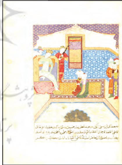
شکل ۴. الف) شاه در کاخ