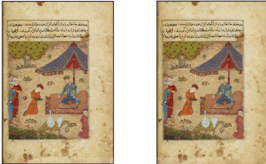
شکل ۱. الف) دیدار سلطان احمد تگودار با سفیر (ب) خطوط اصلی ساختار

شرح نگاره: نگاره دیدار سلطان احمد تگودار با سفیر. این نگاره در ابعاد ۱۱۶ در ۱۵۴ میلی‌متر و در صفحه ۳۰ نسخه قرار دارد.