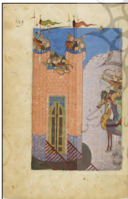
ب) خطوط اصلی ساختار

قرار گرفته است. فردی با لباس نارنجی در وسط تصویر قرار گرفته و در حال تقدیم و یا پذیرایی از شاه است. نوازنده‌ای در سمت چپ و پایین تصویر، در حال اجرای سازی شبیه به عود بوده و چهارزانو بر زمین نشسته است. در پایین‌ترین بخش تصویر، روی میزی، تنگ و صراحی‌ای به رنگ آبی و سفید قرار گرفته است. در قاب پایین تصویر، سه سطر به رنگ سیاه، به زبان فارسی و خط نسخ فارسی نوشته شده است. موارد تحلیل شده در این بخش، در جدول شماره ۳ آورده شده است. از منظر نشانه‌شناسی، پیکره‌های انسانی، درخت و گل‌ها، ساز، فرش، ابر، تخت شاه، گلدان و میز شمایی هستند؛ زیرا بدون هیچ دخل و تصرفی، خود سوژه مورد نظر نگارگر بوده است؛ اما شمایی فیگوراتیو هستند و دقیقاً مانند واقع ترسیم نشده‌اند. بودن ساز در تصویر، نمایه‌ای از مجلس شادی است. برتخت بودن و بالاتر بودن فیگور سمت راست، نمایه‌ای از برتری این فیگور دارد. نشانه نمایه‌ای طبیعت‌گرا است. تخت، نماد سلطنت و پادشاهی است که نماد فیگوراتیوی است. مطالب بیان شده در جدول شماره ۴ آورده شده است.