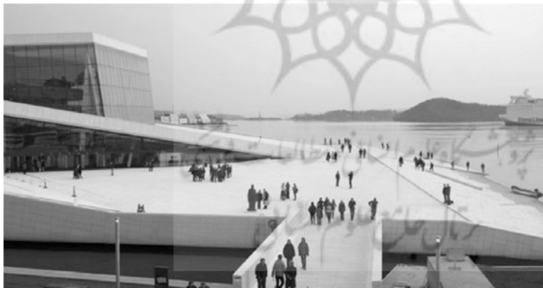
تصویر ۳- خانه ابرای اسلو، طرح معماری از Snohetta

«..... بنابراین بخشی از تعریف مسئله طراحی، میزان جزئیاتی است که باید به آن پردازیم. معمولاً جزئیاتی که برای معماران کم‌اهمیت به نظر می‌رسد ممکن است برای طراحان داخلی یا صنعتی بسیار مهم باشد.» ۱۰ من معماران داخلی را نیز به این دو اضافه می‌کنم.