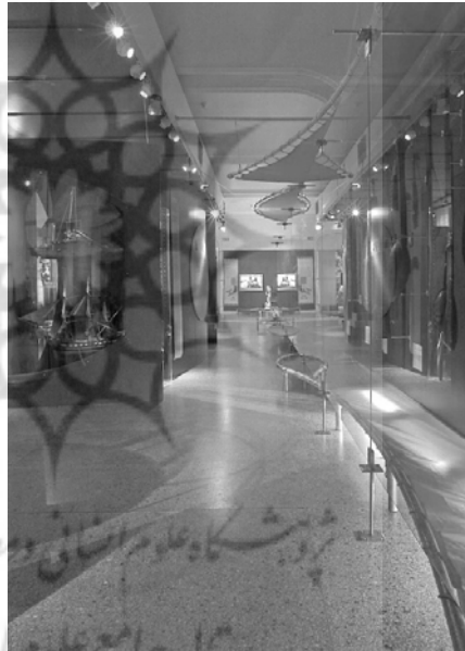
تصویر ۲- طراحی نمایشگاه، موزهٔ تاریخ فرهنگی، اسلو. طرح معماران داخلی MNIL

این بعد نسبت به سایر ابعاد معماری داخلی واضح‌تر است. و من معمار داخلی آن را از روی هویت خودم می‌شناسم. از طراحی انواع محیط‌های انسانی نظیر فضای عمومی، تجاری، محلی و... مثال‌هایی را می‌توان ذکر کرد که به طراحی ادارات، مغازه‌ها، مدارس، بیمارستان‌ها، هتل‌ها، خانه‌های شخصی و... می‌انجامد.