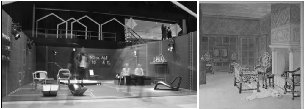
تصویر ۸- پروژه دانشجویی معماری داخلی، طرح Gerd Heiberg، در SHKS سابق یا KHIO فعلی تصویر ۹- غرفه دانشجویان KHIO در نمایشگاه مبلمان استکهلم، ۲۰۰۸. طراحی و اجرای غرفه و مبلمان توسط دانشجویان سال دوم و سوم.

به نظرم برای مواجهه با پیچیدگی و چالش‌های جامعه مدرن باید آموزش را بعد جداگانه‌ای از معماری داخلی بدانیم تا دانشجویان را برای انواع فعالیت‌های حرفه‌ای آینده آماده کنیم. و نیز عرصه و علاقه برای پژوهش را در میان دانشجویان مهیا کنیم.