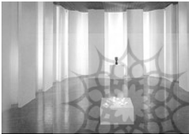
تصویر ۷- آزمایش فضا و نور در مقیاس واقعی، دانشگاه تروندهایم ۱۹۹۵

میزانی آگاهی از پیکره دانش هر زمینه برای توسعه هر دوره آموزشی بسیار مهم است. بنابراین هر چقدر هم دشوار، لازم است قلمروی معماری داخلی پیکره دانش خود را تصریح کند. همه ما با جان اف. پایل ۱۶ موافقیم که توصیف معماری داخلی دشوار است. و می‌بایست اصطلاحات تخصصی آن برای مناظره و بررسی نقادانه شکل بگیرد. ما مدرسان همچنین باید هوشیار باشیم که هدف فعالیت حرفه‌ای با آموزش متفاوت است. به قول یکی از همکارانم، «در حالی که معماران داخلی در کار خود به دنبال حل مسائل انسان از طریق معماری داخلی هستند، مقصود ما مدرسان این است که انسان‌ها را به حرفه‌مندانی بالغ و خلاق با دیدگاه نقادانه و اجتماعی در جامعه ارتقا دهیم.» من دریافته‌ام که یکی از رویکردهای خوب تدریس تمرکز بیشتر بر روش و فرایند پرورش ایده‌ها و استعداد دانشجویان به جای توجه به نتایج نهایی پرزرق و برق است.