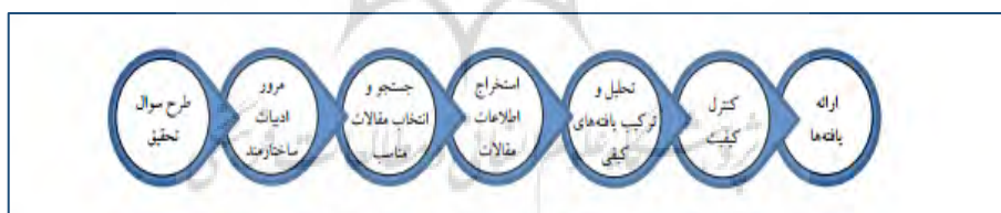
شکل ۱. گام‌های روش فراترکیب (سندبوسکی و باروسو، ۲۰۰۷).

اصولا پژوهش‌های حوزه علوم اجتماعی یا از روش مراجعه به منابع دست اول نظیر مصاحبه، پرسشنامه یا مشاهده انجام می‌شوند، یا اینکه منابع ثانویه داده‌ها نظیر کتب، مقالات و مستندات مبنای پژوهش قرار می‌گیرند. بر این اساس با توجه به اینکه پژوهش حاضر به منظور ساماندهی و بهره‌برداری از دانش موجود و شناخت خلاءهای پژوهشی در مطالعات گذشته از طریق تحلیل نظام‌مند متون انجام شده است آن را می‌توان از نوع ثانویه دانست. در واقع پژوهش حاضر از نظر هدف بنیادین و از لحاظ ماهیت داده‌ها و سبک تحلیل جزو پژوهش‌های کیفی به شمار می‌رود که در آن داده‌های پژوهش با استفاده از روش فراترکیب ۱ جمع‌آوری و تحلیل شده است. فراترکیب نوعی مطالعه کیفی است که اطلاعات و یافته‌های استخراج شده از مطالعات کیفی دیگر با موضوع مرتبط و مشابه را بررسی می‌کند و با فراهم کردن نگرشی نظام‌مند برای محققان از طریق تلفیق پژوهش‌های کیفی مختلف به کشف موضوعات و استعاره‌های نوین می‌پردازد، دانش جاری را ارتقاء داده و نگرش جامعی نسبت به مسائل ایجاد می‌کند. رایج‌ترین الگوهای مورد استفاده برای روش فراترکیب الگوی سه مرحله‌ای نوبلت و هیر ۲ (۱۹۸۸)، الگوی شش مرحله‌ای والش و داون ۳ (۲۰۰۵) و الگوی هفت مرحله‌ای سندبوسکی و باروسو ۴ (۲۰۰۷) است. در پژوهش حاضر از روش هفت مرحله‌ای سندبوسکی و باروسو ۴ (۲۰۰۷) استفاده شد که مراحل آن در شکل ۱ مشاهده می‌شود.