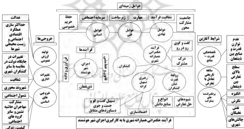
شکل ۱. الگوی مفهومی پژوهش

۲۰۱۸؛ اله و کیم، ۲۰۲۰). ازسوی دیگر در راستای تحقق حکمرانی همیارانه شهری دو عنصر رهبری تسهیل‌گرانه که شامل توانمندسازی و حمایت است (گریزلی و استوکر ۱ ، ۲۰۰۸) و روابط قدرت میان کنشگران که شامل شیوه‌های حل تعارض میان کنشگران (بخش عمومی، بخش خصوصی و اجتماعات محلی و ساکنان) است بر فرایند همکارانه دخیل است (هودسنی، ۱۳۹۴). اجزای حکمرانی شهر هوشمند عبارت است از: ذی‌نفعان، ساختار و سازمان، فرایندها، نقش‌ها و مسئولیت‌ها، فناوری و داده (مهارت، زیرساخت، دسترسی، توانمندی)، قانون و خط‌مشی‌ها، تمهیدات تبادلی، عوامل انسانی، عوامل نهادی (رولند، ۲۰۱۸). خروجی‌های فرایند حکمرانی همیارانه شهر هوشمند عبارت است از: به‌اشتراک‌گذاشتن دانش و اطلاعات، تولید ارزش عمومی، یادگیری اجتماعی، نوآوری اجتماعی، هوش جمعی، تحول شهر، ارائه بهتر خدمات به شهروندان، ارتقای کیفیت زندگی در شهر، خروجی‌های اساسی، تغییرات اداری، آموزش و یادگیری همکارانه، نوآوری نهادی همکارانه، خط‌مشی‌گذاری همکارانه و اقدامات مشارکتی (میجر و همکاران، ۲۰۱۶؛ ترانوس و گرتنر ۲ ، ۲۰۱۲).