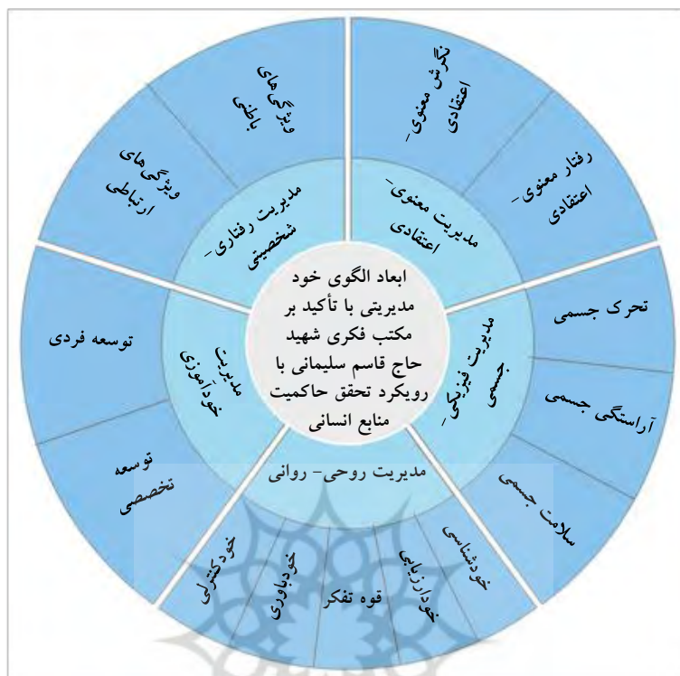
شکل (۲). طراحی الگوی خود مدیریتی با تأکید بر مکتب فکری شهید حاج قاسم سلیمانی با رویکرد تحقق حاکمیت منابع انسانی (منبع: یافته‌های تحقیق)