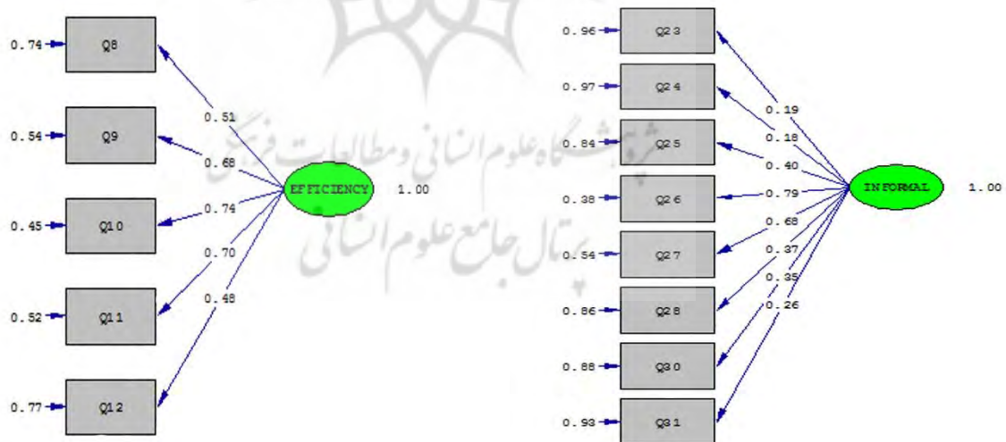
شکل ۱- خروجی لیزرل برای تحلیل عاملی تأییدی عامل مکنون یادگیری غیررسمی و خودکارآمدی

Chi-Square=۵۶/۱۶ df=۲۰ P-value=۰/۰۰۰۰۰ MSEA=۰/۰۶۱ Chi-Square=۱۲/۹۱ df= ۵ P-value=۰/۰۰۰۰۰ RMSEA=۰/۰۷