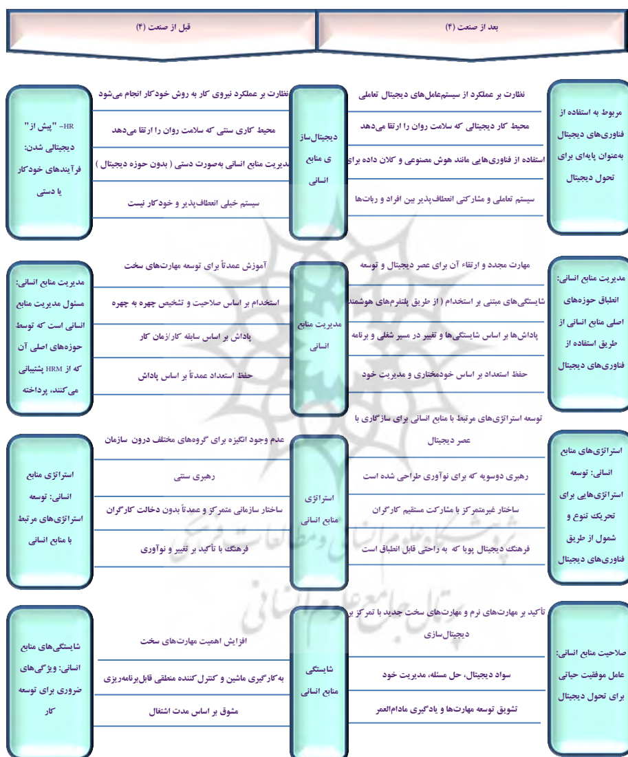
شکل ۲. تحول در منابع انسانی قبل و بعد از صنعت نسل (۴)

توسط تجربه شغلی، مهارت‌ها و مؤلفه‌های شخصی تعریف گردد (درسلاهاوس ۱ ، ۲۰۱۰: ۲۰). تحولات مهمی در زمینه مؤلفه‌های منابع انسانی، قبل و بعد از صنعت نسل (۴) انجام شده است. شکل (۲) بیانگر این تحولات و به ویژه شایستگی‌های منابع انسانی است: