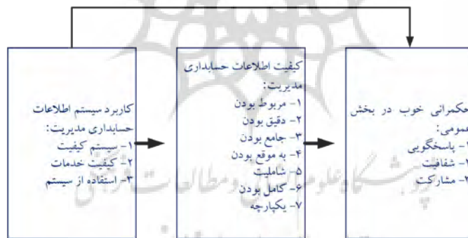
شکل ۲. نقش سیستم اطلاعات حسابداری مدیریت بر مسئولیت پاسخگویی، شفافیت و مشارکت

همانطور که شکل (۱) نشان می‌دهد، زیرساخت‌های حسابداری هرچقدر بهتر و قویتر باشند، تاثیر بیشتری بر فرهنگ پاسخگویی داشته و از طرفی با پیاده‌سازی سیستم‌های بودجه‌ریزی جامع‌تر و بهتر و همچنین، مدیریت عملکرد، مدیریت هزینه‌ها در بخش عمومی را نیز تحت‌تأثیر قرار می‌دهد. بر مبنای اظهارات مک‌لد (۲۰۰۷) کیفیت اطلاعات حسابداری مدیریت دارای ویژگی‌هایی مثل مربوط بودن، دقیق بودن و کامل بودن است. سیستم اطلاعات حسابداری مدیریت، یک سازوکار کنترلی و یک ابزار موثر برای ارائه اطلاعات سودمند برای پیش‌بینی پیامد فعالیت‌های انجام شده در سازمان می‌باشد (چنال و موریس، ۱۹۸۶، گامایونی، ۲۰۱۹: ۱۲۴۸). شکل (۲) تاثیر سیستم اطلاعات حسابداری مدیریت بر پاسخگویی، شفافیت و مشارکت را نشان داده است. ویژگی کیفی مربوط بودن، یعنی متناسب بودن اطلاعات ارائه شده با نیازهای شناسایی شده است. ویژگی کیفی دقیق بودن، یعنی اطلاعات ارائه‌شده، شرایط واقعی را نشان می‌دهد. جامع بودن اطلاعات، یعنی اینکه اطلاعات کامل به نظر می‌رسد. به‌موقع بودن، یعنی اینکه دسترسی به اطلاعات زمانی که مورد نیاز است، وجود دارد. شمولیت، یعنی اینکه با اطلاعات در دسترس بتوان رویدادهای آتی را پیش‌بینی کرد. کامل بودن، یعنی اینکه اطلاعات با وجود مختصر بودن هنوز کامل هستند. یکپارچگی، یعنی اطلاعات ارائه شده ارتباط بین واحدهای مختلف را منعکس می‌کند.