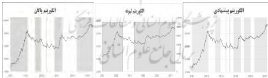
شکل ۳. مقایسه‌ای از طبقه‌بندی رژیم‌ها در هر الگوریتم در بخشی از دوره نمونه

شکل (۳) تفاوت شناسایی رژیم‌ها در سه الگوریتم را در مقطعی از زمان در شاخص کل قیمت بورس اوراق بهادار تهران نشان داده است. همان‌طور که مشخص است الگوریتم پیشنهادی تعداد رژیم‌های بیشتر و کوتاه‌تری را شناسایی کرده است در صورتی که الگوریتم لیونه تعداد رژیم کمتر و الگوریتم پاکان نیز رژیم‌های کمتر با طول زمانی بیشتری را شناسایی کرده است.