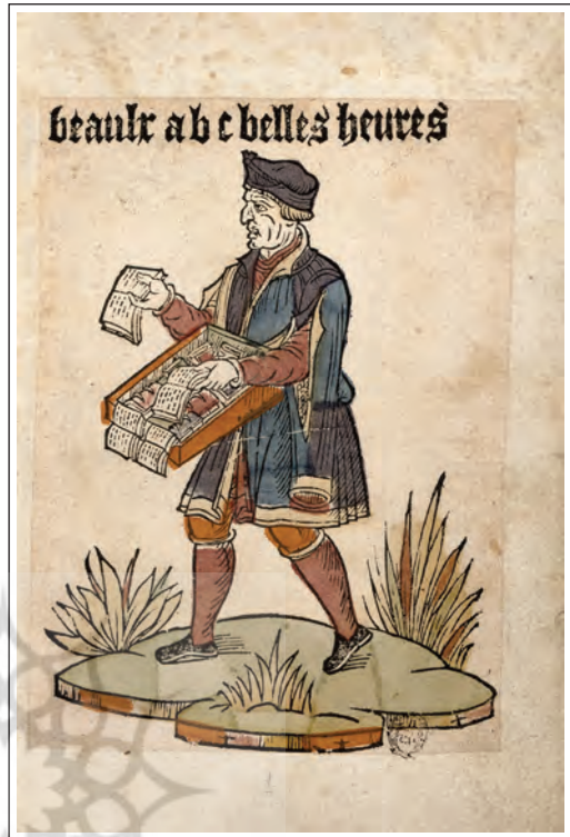
تصویر ۱. کتابفروش دوره‌گرد، قرن ۱۶ میلادی، کتابخانه آرسنال، RES-EST-۲۶۴ (فرانسه)