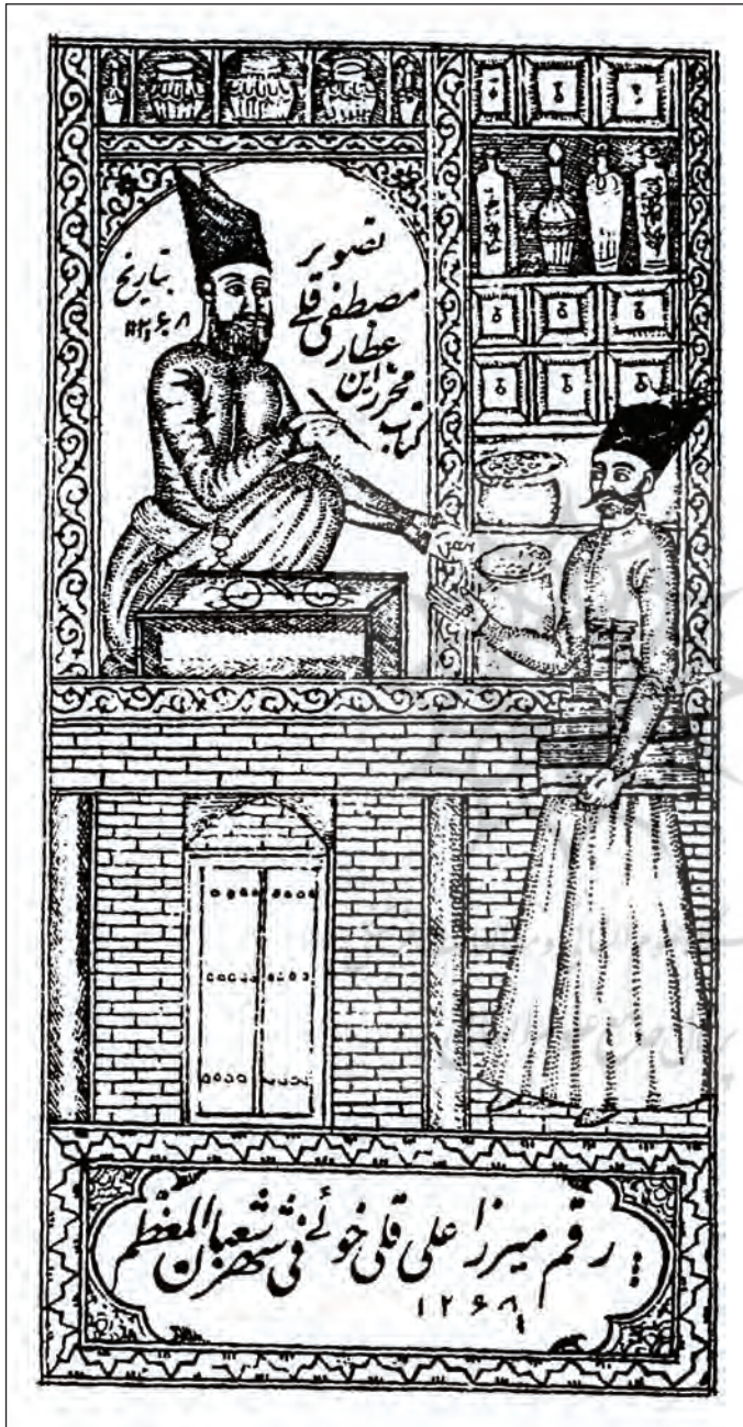
تصویر ۴. مصطفی قلی کجوری کاتب و کتابفروش دوره گرد، برگرفته از کتاب کلیات سعدی، طهران، چاپخانه عبدالمحمد رازی، ۱۳۶۸.ق.ن