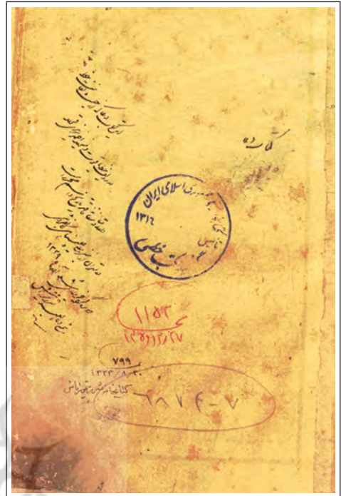
تصویر ۷. یادداشت تملک و خرید نسخه خطی دعا توسط شررتیمورتاش (کتابخانه ملی)