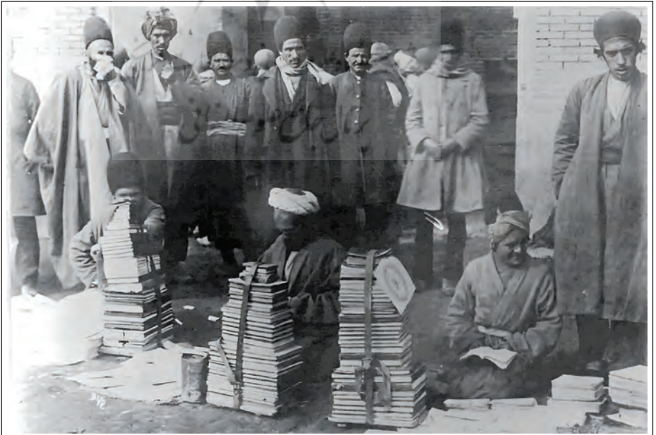
۲۰۳ آینه پژوهش سال ۳۴، شماره ۵ آذر و دی ۱۴۰۲