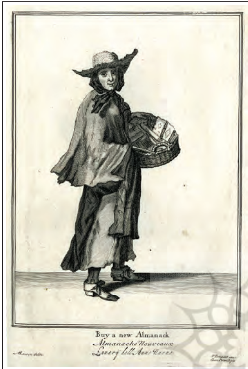
تصویر ۲. کتابفروش دوره‌گرد زن، ۱۶۸۸م.