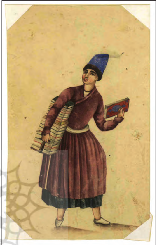
تصویر ۵. کتابفروش جوان دوره‌گرد (کتابخانه مجلس)