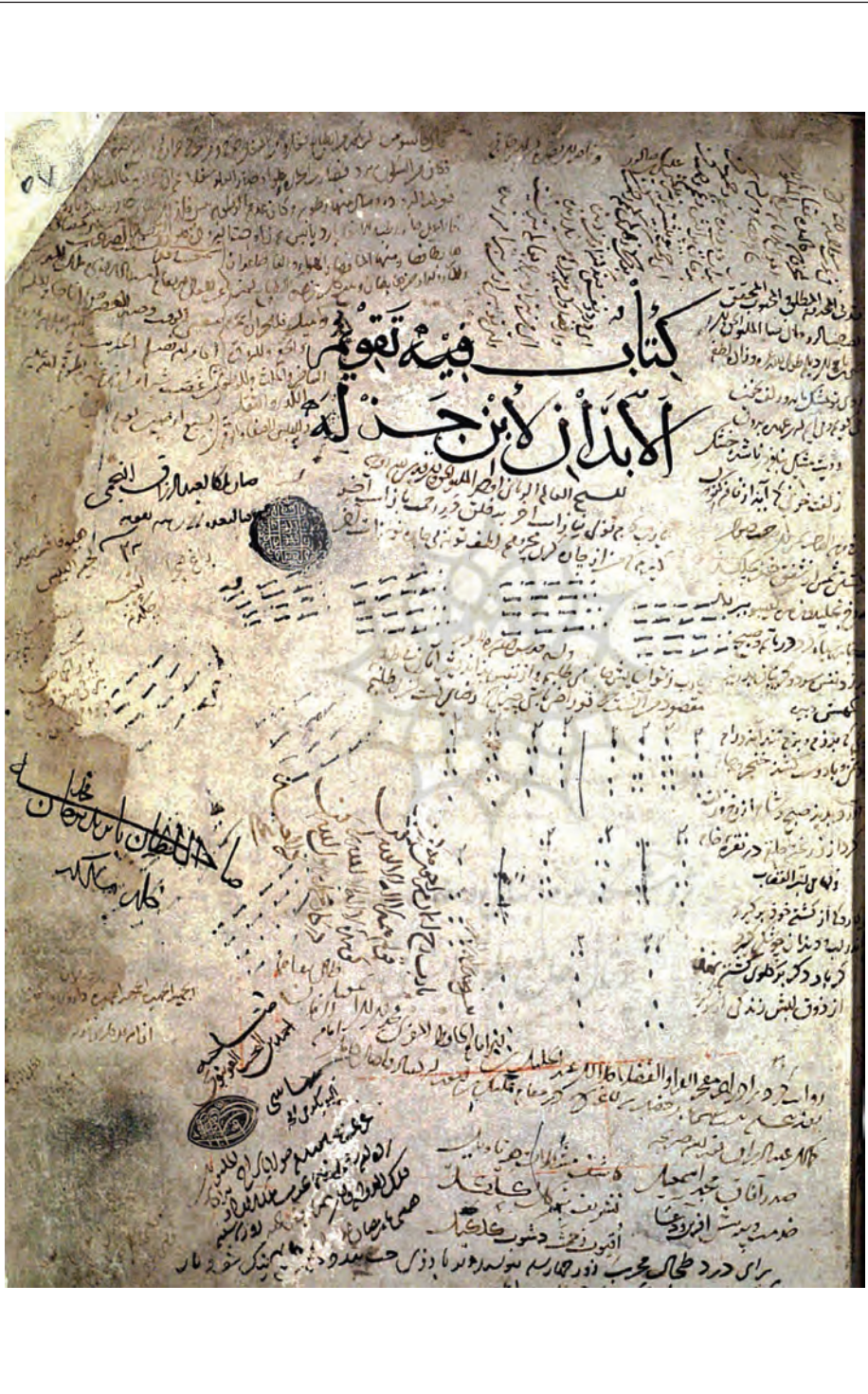
تقویم الابدان، دستنویس شماره ۳۵۸۷ کتابخانه ایاصوفیا، سده هشتم ق، ظهر نسخه

آینه پژوهش ۲۰۲۰ سال ۳۴، شماره ۴ مهر و آبان ۱۴۰۲