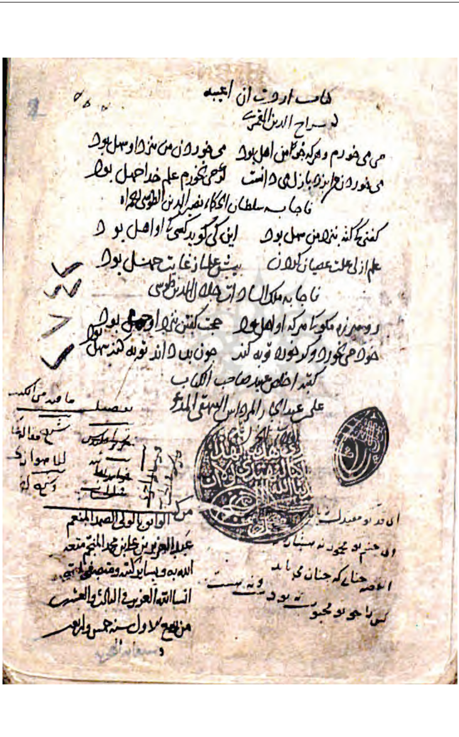
دستنویس شماره ۲۲۴۲ کتابخانه ایاصوفیا، ۲۲۴- ۷۲۵ ق، برگ ۲