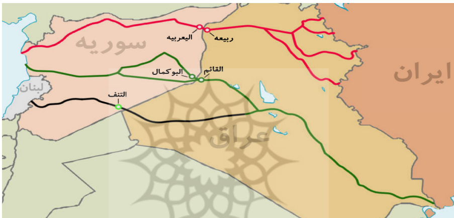
نقشه ۲ راه‌گذر زمینی تهران و مدیترانه

می‌رسید که ایران بتواند بر راه‌گذری از تهران تا مدیترانه مسلط شود. با وجود این در سال ۲۰۱۷ و با توجه به تحولات میدانی در سوریه و عراق، ارزیابی‌های کارشناسان در این باره متحول شد و در اوایل سال ۲۰۱۸ تقریباً اتفاق نظر درباره معنای «پل زمینی» به وجود آمد. به اعتقاد نویسندگان، گسترش نفوذ ایران در عراق به دلیل ظهور حشدالشعبی موجب شد تا تعریف پل زمینی به «راه‌گذر از تهران تا مدیترانه» تعمیم پیدا کند، نه فقط مسیری از دمشق تا لبنان در نقشه ۲ نقشه زمینی راه‌گذر را آمده است (Adesnik and Taleblu, 2019: 9).