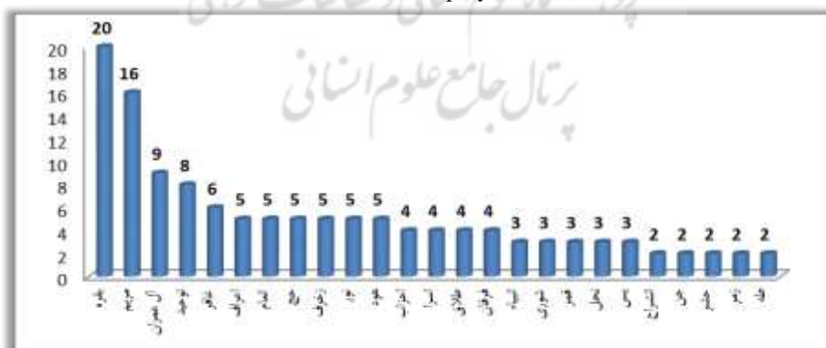
Chart 3: Measurement of the frequency of direct adaptation of the Qur'anic surahs in Razavi's prayer