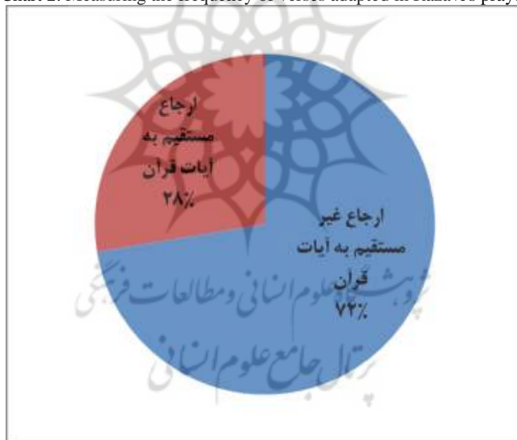
Chart 2. Measuring the frequency of verses adapted in Razavi's prayer

امام رضا(ع) در برخی ادعیه خود با توجه به غرر آیات قرآن به طرح مسائل و خواسته‌های مختلفی پرداخته‌اند. به عنوان مثال ایشان در دعای شماره ۴۵ می‌فرمایند: «إِذَا ذَهَبَ لَكَ ضَالَّةٌ أَوْ مَتَاعٌ فَقُلْ "وَعِنْدَهُ مَفَاتِحُ الْغَيْبِ ... فِي كِتَابٍ مُبِينٍ" ثُمَّ تَقُولُ اللَّهُمَّ إِنَّكَ تَهْدِي مِنَ الضَّالَّةِ وَ تُنَجِّي مِنَ الْعَمَى وَ تَرُدُّ الضَّالَّةَ» (موحد ابطحی اصفهانی، ۱۳۹۱، دعای ۴۵). همچنین در دعای