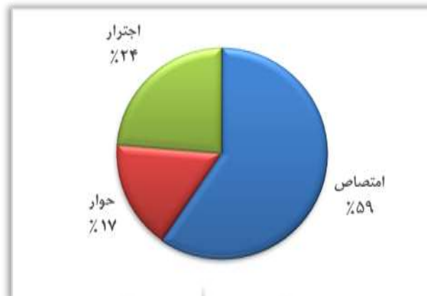
Chart 5: Measuring the frequency of types of intertextual relationships in Razavi's claim

در ادامه این تحقیق به منظور تبیین هرچه بهتر مفهوم رابطه بینامتنی متوازی یا امتصاص، دو نمونه از ادعیه و روابط بینامتنی آن‌ها با آیات قرآن کریم تحلیل و بررسی شده است که نشان می‌دهد چگونه امام رضا(ع) با بهره‌گیری خفیف و تلمیحی از آیات قرآنی، سعی در بیان مطالب و معارفی عمیق در دعاهای خود داشته‌اند.