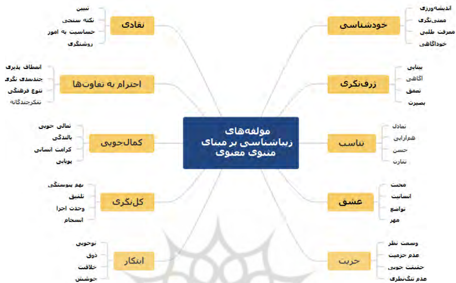
شکل ۱. مولفه‌های زیبایی‌شناختی برنامه درسی بر مبنای مثنوی معنوی