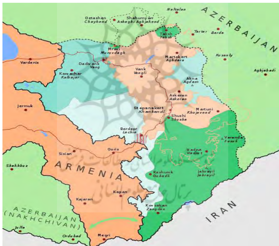
شکل ۳. نقشه مفهومی جمهوری آذربایجان و ارمنستان پس از اجرای توافقنامه

خواهد بود. ۵. یک مرکز صلح برای نظارت بر آتش بس ایجاد خواهد شد. ۶. ارمنستان استان کلبر را تا پانزدهم ماه نوامبر و لاجین را تا اول دسامبر ۲۰۲۰ پس می دهد. ۷. تمامی آوارگان رانده شده قره باغ و مناطق اطراف به وطن خود باز خواهند گشت. ۸. تبادل اسرای جنگی و اجساد کشته ها و قربانیان انجام خواهد گرفت. ۹. ارمنستان برای عبور و مرور شهروندان آذربایجانی و محموله های تجاری از منطقه نخجوان به جمهوری آذربایجان، گذرگاه امنی را در اختیار آذربایجان قرار می دهد و امنیت این گذرگاه را روسیه تأمین خواهد کرد. ۱۰. تردد شهروندان ارمنی و محموله ها از منطقه قره باغ به جمهوری ارمنستان از طریق گذرگاه لاجین انجام خواهد شد (Kremlin.ru, 10, November 2020) and (Kramer, 2020).