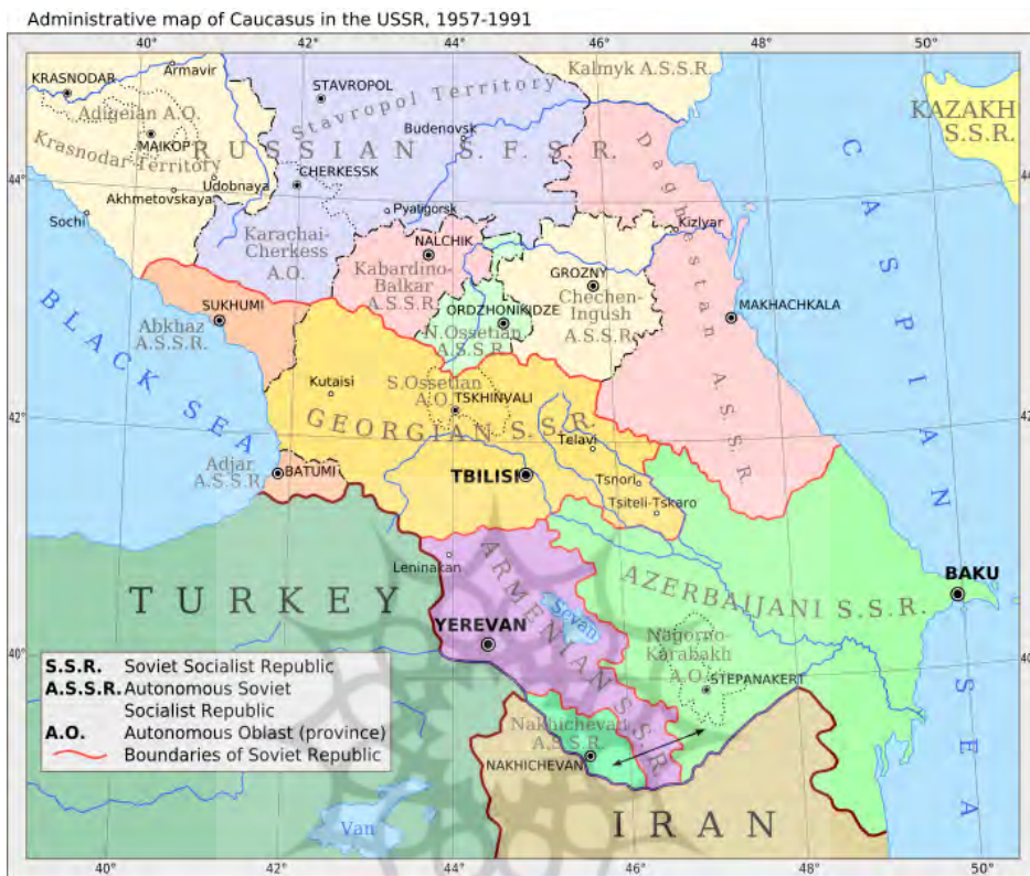
شکل ۱. تقسیمات سیاسی منطقه قفقاز

از منظر طبیعی نیز قفقاز منطقه‌ای کوهستانی در جنوب غربی روسیه و در همسایگی شمال غربی ایران است. این منطقه از غرب به دریای سیاه و آزوف، از شرق به دریای مازندران، از شمال به اراضی پست کوما-مانیچ و از جنوب به ایران و ترکیه محدود می‌شود (تقوی اصل، ۱۳۷۹: ۱۹). سلسله ارتفاعات قفقاز بزرگ، این منطقه را به دو نیمه جنوبی شامل آذربایجان، ارمنستان و گرجستان و نیمه شمالی شامل جمهوری‌های خود مختار داغستان، چچن، اینگوش، اوستیای شمالی، کایاردا بالکار، قاراچای - چرکس و آدیگه هستند، تقسیم نموده است (افشردی، ۱۳۸۱: ۳۷). در مباحثات منطقه‌ای قفقاز شمالی حیات خلوت روسیه به شمار می‌رود. قفقاز جنوبی نیز شامل کشورهای آذربایجان، ارمنستان و گرجستان است که یکی از مناطق پرتنش جهان بوده و منطقه‌ای شکننده