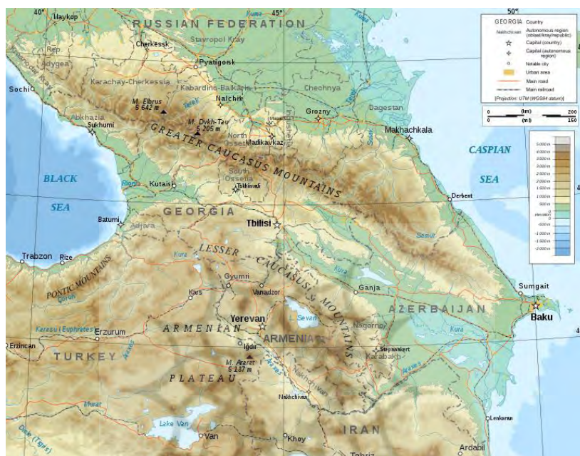
شکل ۲. توپوگرافی قفقاز

محسوب می‌شود. اختلافات مرزی گرجستان و روسیه و مناقشه قره‌باغ میان آذربایجان و ارمنستان از مهمترین مناقشات چندسال اخیر بوده که توجه رسانه‌ها را به خود جلب کرده است.