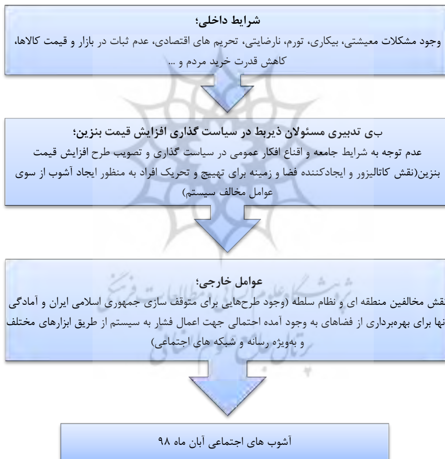
شکل ۳. بسترها و زمینه‌های وقوع بحران سیاسی - اجتماعی در ایران (آبان ۱۳۹۸) (نگارندگان)

تلاش نکند. هدف درازمدت این طرح، «براندازی رژیم ایران» بوده است. در واقع، سعودی‌ها گفته بودند رژیمی در ایران بر سر کار بیاید که منافع پادشاهی عربستان سعودی و ایالات متحده را فراهم کند. در دل این طرح سه‌ساله، یک طرح یک‌ساله داشتند که طبق آن، به ایران بفهمانند که آنچه را که در منطقه با عنوان دخالت‌های منطقه‌ای انجام می‌دهند باید تاوانش را در داخل کشور پس دهند؛ بنابراین، از سال ۱۳۹۵ برنامه‌ریزی جدی انجام دادند که نتایج آن را در آشوب‌های ۹۶ و ۹۸ مشاهده می‌کنیم. (نجفی سیار، ۱۳۹۸). به‌طور کلی بسترها و زمینه‌های وقوع بحران سیاسی اجتماعی در ایران (آبان ۱۳۹۸) در شکل زیر آورده شده است: