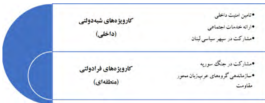
شکل ۲. مدل مفهومی: حزب‌الله لبنان به عنوان یک بازیگر ترکیبی

جنگ سوریه و مدیریت گروه‌های عرب‌زبان محور مقاومت مهم‌ترین نشانگان این امر محسوب می‌شود.