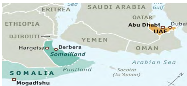
شکل ۳. موقعیت راهبردی جزایر پانتلند و سومالی‌لند

شبه‌خودمختار را افزایش داد. دی. پی. ولد ۱ در سال ۲۰۱۷ قراردادی به ارزش ۳۳۶ میلیون دلار برای توسعه و مدیریت بندر بوساسو به امضا رساند. به‌علاوه، این شرکت اماراتی از اکتبر ۲۰۱۸ بیش از ۴۴۲ میلیون دلار برای توسعه بندر بربرای سومالی‌لند سرمایه‌گذاری کرد (Fenton-Harvey, 2020).