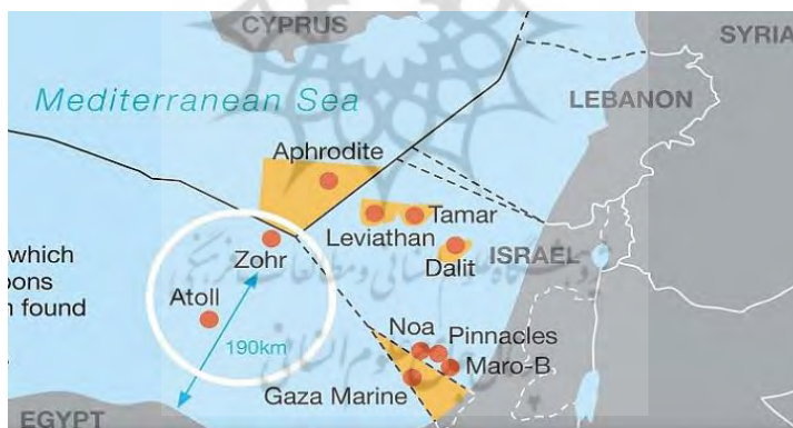
شکل ۲. میدان گازی زهر

به‌موازات کنترل بر عناصر سیاسی و نظامی قاهره، ابوظبی امتیازات زیادی را در حوزه‌های بندری، نفت و گاز، ارتباطات و ساخت و ساز به‌دست آورد. ابوظبی در قالب برنامه مشارکت راهبردی با مصر که در آوریل ۲۰۱۸ رونمایی شد (Emirates News Agency, 2019)، در صدد شکل‌دهی به چشم‌انداز رهبران این کشور به‌بهانه استقرار الگوی حکومتی مشترک عربی است. امارات در راستای اعمال سلطه اقتصادی بر مصر، راهبرد تنظیم قیمت پوند این کشور را نیز در دستورکار قرار داده است. این راهبرد از طریق افزایش سرمایه‌گذاری خارجی و وابسته‌کردن پوند مصر به واحد پول امارات صورت می‌گیرد. سرمایه‌گذاری‌های امارات با جهشی فوق‌العاده به ۶٫۶ میلیارد دلار در سال ۲۰۱۸ و ۷٫۲ میلیارد دلار در سال ۲۰۱۹ رسید. در جریان دیدار ۱۶ نوامبر ۲۰۱۹ السیسی از امارات و دیدار با محمد بن زاید، طرفین در زمینه سرمایه‌گذاری مشترک ۲۰ میلیارد دلاری در طرح‌های اقتصادی و اجتماعی توافق کردند. در مارس ۲۰۱۸ نیز شرکت مبادله پترولیوم ۱۰ درصد از امتیاز میدان عظیم گازی زهر ۱ در مدیترانه را با مبلغ ۹۳۴ میلیون دلار به‌دست آورد (بزرگترین میدان گازی مدیترانه با بیش از ۳۰ تریلیون فوت مکعب ذخایر گازی) (Megahid, 2018).