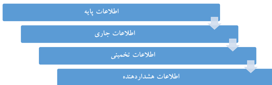
شکل ۴. خروجی فعالیت و تحلیل اطلاعاتی

در همین راستا، پیش‌گیری از غافل‌گیری مهم است. پیش‌گیری به معنای جلوگیری کردن، مانع‌شدن، جلوگیری را بستن (معین، ۱۳۷۵) و نیز اقدام‌های احتیاطی برای جلوگیری کردن از رخداد‌های ناخواسته (مشیری، ۱۳۶۴) است و از آن مفهوم پیش‌دستی کردن، پیش‌گرفتن و جلوگیری رفتن و نیز آگاه‌سازی و هشداردهی به دست می‌آید. بدین ترتیب، مفهوم پیش‌گیری از غافل‌گیری، جلوگیری و مانع‌شدن از آماده‌نبودن در برابر پدیده‌های مخاطره‌آمیز امنیتی است که با کار دقیق اطلاعاتی حاصل می‌گردد. در هشداردهی، به‌منظور پیش‌گیری از غافل‌گیری، نوعی پیش‌بینی صورت می‌گیرد که در یک نگاه «به مفهوم شناخت پیشینی قطعی یا نسبتاً قطعی درمورد وقایع آتی در جهان پدیده‌های اجتماعی» است که موضوع مطالعه و کنش سازمان‌های اطلاعاتی است (هولت، ۱۹۹۵: ۸۵). بی‌تردید هرچه این پیش‌بینی، عالمانه‌تر و مبتنی بر داده‌های عینی و دقیق باشد، نتیجه‌بخش‌تر نیز خواهد بود.