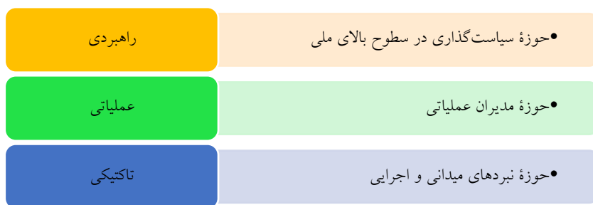
شکل ۱. سطوح هشدار اطلاعاتی

هشدار اطلاعاتی به ما اجازه می‌دهد که کار آتی رقیب را بفهمیم و متناسب با آن، برنامه‌ریزی و اقدام داشته باشیم. هشدار اطلاعاتی می‌تواند در سطوح مختلف راهبردی (مخاطب: سیاست‌گذاران در سطوح بالای ملی)، عملیاتی (مخاطب: فرماندهان عملیاتی و افسران ارشد) و تاکتیکی (مخاطب: حوزه‌های میدانی و عملیاتی) دنبال شود. شکل زیر این سطوح را به نمایش می‌گذارد: