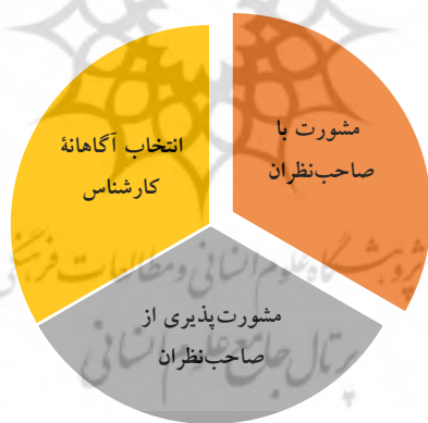
شکل ۸. مقوله‌های مؤلفه کلان مشورت‌طلبی و مشورت‌پذیری فعالانه

این مؤلفه شامل سه مقوله است: مشورت با صاحب‌نظران، مشورت‌پذیری از صاحب‌نظران و انتخاب آگاهانه کارشناس.