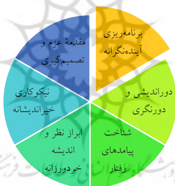
شکل ۱۰. مقوله‌های مؤلفه کلان بررسی و تصمیم شناختمند هوشیارانه

مؤلفه بررسی و تصمیم شناختمند هوشیارانه شامل مقوله‌های زیر است: برنامه‌ریزی آینده‌نگرانه، دوراندیشی و دورنگری، شناخت پیامدهای رفتار، ابراز نظر و اندیشه خردورزانه، نیکوکاری خیراندیشانه و مقدمه عزم و تصمیم‌گیری.