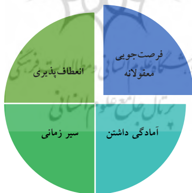
شکل ۹. مقوله‌های مؤلفه کلان فرصت‌جویی آگاهانه

این مؤلفه شامل چهار مقوله است: فرصت‌جویی معقولانه، آمادگی داشتن، سیر زمانی و انعطاف‌پذیری.