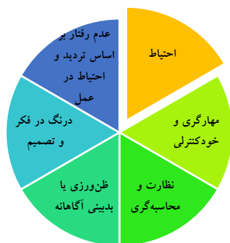
شکل ۶. مقوله‌های مؤلفه کلان احتیاط و ظن‌ورزی خردمندانه