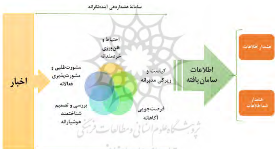
شکل ۵. فرایند سامانهٔ هشداردهی آینده‌نگرانه مبتنی بر حزم اطلاعاتی

در یک نگاه استنباطی با اتخاذ از تجزیه و تحلیل روایات فراوان پیرامون این موضوع در منابع مورد نظر روایی، حزم اطلاعاتی دارای مؤلفه‌های کلان پنج‌گانه است: احتیاط و ظن‌ورزی خردمندانه، کیاست و زیرکی مدبرانه، فرصت‌جویی آگاهانه، تصمیم و بررسی شناختمند هوشیارانه، مشورت‌طلبی و مشورت‌پذیری فعالانه. با عنایت به مباحث پیشین، اکنون می‌توان مدل مفهومی سامانهٔ هشداردهی آینده‌نگرانه مبتنی بر حزم اطلاعاتی را به شرح زیر ارائه داد: