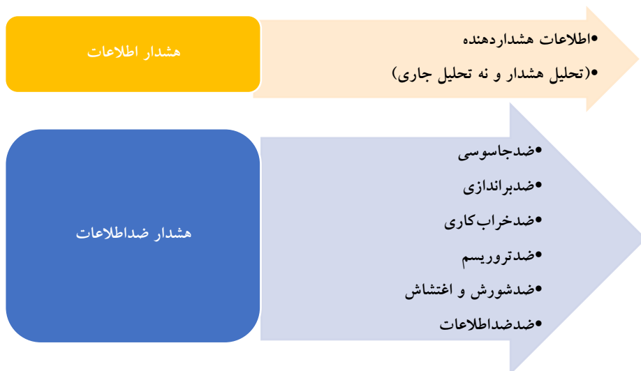
شکل ۲. قالب دوگانه هشداردهی اطلاعاتی

سؤال این است که چه زمانی، در چه شرایطی، در کدام موقعیتی و در کدام مکانی، تحلیل هشداردهنده معنا و مفهوم می‌یابد. به‌عنوان مثال برای ایران اسلامی، کودتا در یکی از کشورهای منطقه نظیر ترکیه یا عراق یا...، رفراندوم استقلال کردستان در عراق، جدایی‌طلبی بلوچ‌های پاکستان از دولت مرکزی، اعلام قدس به‌عنوان پایتخت رژیم اشغالگر فلسطین و انتقال سفارت امریکا به قدس شریف، تغییر و تحولات سیاسی در کشورهای منطقه به‌ویژه عربستان و... تحلیل هشدار است یا تحلیل جاری. در وضعیت داخلی تغییر جمعیتی در مرزها و نیز در بسیاری از شهرها، تک‌فرزندی شدن اکثر خانواده‌های شیعی، بروز فساد اداری در بسیاری از اداره‌ها و میان کارمندان، تحلیل هشدار است یا تحلیل جاری. اختلال است یا آسیب یا اضطرار یا بحران یا تهدید؟ فوری است یا معمولی؟ در هر حال، کار ویژه اطلاعات هشداردهنده آن است که پیوسته از خلال گزارش ادواری یا روزانه یا...، هر تغییر و تحولی را که لازم است از عملکردهای داخلی و خارجی اطلاع دهد؛ این اطلاع باید مبتنی بر نشانه‌ها ۱ باشد که می‌تواند علامت، گواه، پیشنهاد یا مجموعه‌ای از استنتاج‌ها برای باور امری باشد. مراد از نشان دادن ۲ از حیث لغت، حالتی کمتر از اطمینان است. انتخاب این لفظ برای هشدار اطلاعاتی، شناختی واقع‌گرا از این امر است که احتمالاً