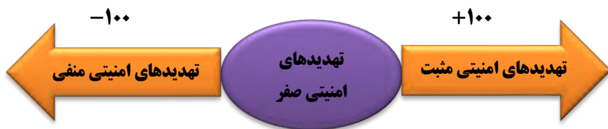
شکل ۱. طیف‌بندی محیط تهدیدهای امنیتی ج.ا.ایران