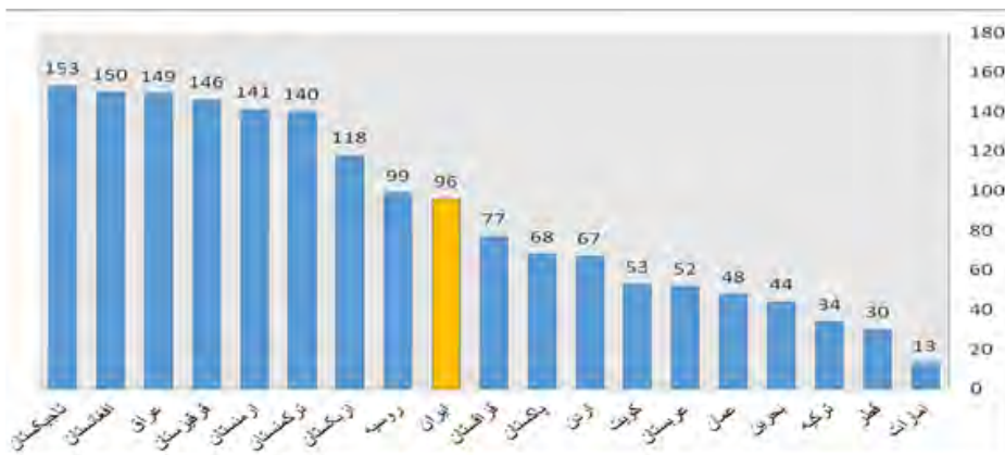
نمودار ۱: رتبه کشورهای منطقه در شاخص لجستیک تجاری سال ۲۰۱۶ (۱۶۰ کشور)