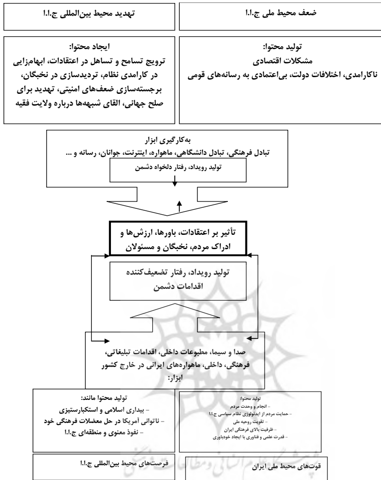
شکل ۱- مدل مفهومی تأثیر و تأثر دیپلماسی عمومی ایران و آمریکا بر سیاست خارجی آمریکا