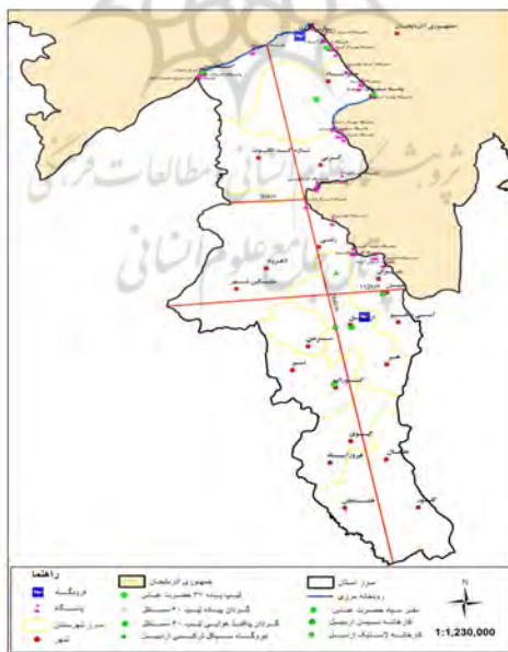
نقشه ۳- اماکن نظامی و غیرنظامی استان اردبیل (ترسیم نگارندگان با استفاده از نرم‌افزار GIS ARC)

معبر وصولی بیله سوار- گرمی- اردبیل با جهت شمالی- جنوبی در استان اردبیل به عنوان مهم‌ترین محور نفوذی، قابلیت بهره‌برداری برای یگان‌های نظامی کشور هم‌جوار را دارد. تسلط ارتفاعات جمهوری آذربایجان، که ادامه کوه‌های تالش به شمار می‌رود، بر این معبر وصولی مهم در بیشتر طول جاده به ویژه در فاصله شهرهای رضی و بیله سوار که جاده نزدیک مرز قرار دارد، از نظر آمایش دفاعی و نظامی حایز اهمیت است (نقشه توپوگرافی ۴). از سوی دیگر شهر اردبیل به عنوان یکی از پادگان‌های نظامی پشتیبانی‌کننده خطوط مواصاتی شمال غرب و شمال استان اردبیل (به ویژه معبر وصولی بیله سوار- گرمی- اردبیل با جهت شمالی- جنوبی) به دلیل عبور از گردنه حساس حیران، ورود و خروج از آن به داخل کشور از گذشته‌های دور ضعف عملیاتی- نظامی داشته است. تسلط کامل نظامی ارتفاعات جمهوری آذربایجان بر جاده آستارا - اردبیل نیز از آسیب‌پذیری این جاده حکایت دارد. هرچند با احداث جاده جدید اردبیل- سرچم- میانه- تهران تا حدود زیادی از اتکای استان به جاده آستارا - اردبیل کاسته شده است، به دلیل غیراستاندارد بودن این جاده و تکمیل نشدن ظرفیت کامل آن اقدامات زیادی ضرورت دارد. (نقشه‌های ۲ و ۴ مسیر این جاده را نشان می‌دهد).