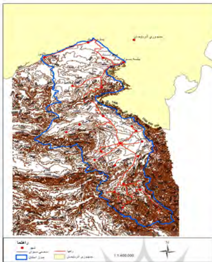
نقشه ۴ - توپوگرافی استان اردبیل و مناطق مرزی کشور همجوار (ترسیم نگارندگان با استفاده از نرم‌افزار GIS ARC)

متصل نشدن استان اردبیل به شبکه ریلی کشور یکی دیگر از مشکلات ارتباطی این استان است. گذشته از مزایای اقتصادی اتصال استان اردبیل به شبکه ریلی کشور که با اجرای پروژه راه آهن میانه - اردبیل در آینده نزدیک امکان پذیر خواهد شد، گامی مهم و مؤثر برای تقویت و پشتیبانی نیروهای نظامی کشور در شرق آذربایجان خواهد بود. از سوی دیگر، به لحاظ اقتصادی و تجاری ادامه احداث خط آهن بین منطقه مغان در استان اردبیل و یکی از نقاط مرزی جمهوری آذربایجان از جمله ایمنی، بخش مهمی از مشکلات در حوزه حمل و نقل بین دو کشور را برطرف می‌کند و اقتصاد منطقه به ویژه مناطق مرزی متحول می‌شود. با ایجاد این خط آهن، جمهوری اسلامی ایران به راحتی می‌تواند به دریای سیاه راه یابد و استان‌های شمال غربی نیز می‌توانند با آن سوی قفقاز ارتباط برقرار کنند ( http://www.magiran.com ). مطلب مهم دیگر در زمینه ارتباطات با کشور جمهوری آذربایجان، موضوع پایانه‌های مرزی بین دو کشور است. با فروپاشی شوروی به نظر می‌رسید پایانه‌های مرزی شمال غرب کشور نقشی فعال و تعیین‌کننده در ارتباطات با کشورهای تازه استقلال یافته بر عهده بگیرند. بررسی میزان فعالیت این پایانه‌ها دست کم در استان اردبیل نشان می‌دهد که فعالیت آنها در سطحی مطلوب نبوده است؛ به طوری که از سه پایانه مرزی بیله سوار،