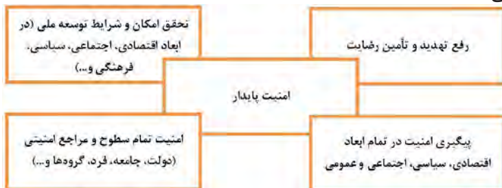
شکل ۱: ابعاد مفهومی امنیت پایدار

در مجموع، امنیت پایدار به معنی تداوم حیات یک نظام سیاسی (و اجتماع ملی) در طول زمان است که از طریق ایجاد توازن و تعادل در تأمین امنیت مراجع مختلف و سطوح و ابعاد آن امنیت محقق و موجب رفع و مقابله با تهدیدها، و تأمین رضایت و مشارکت عمومی می‌شود و امکان پیگیری سیاست‌های توسعه ملی را فراهم می‌کند.