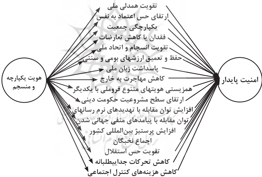
شکل ۲: چارچوب مفهومی رابطه هویت با امنیت ملی

از نگاه نخست می‌توان به تأثیر یا نقش هویت‌های جمعی در تولید امنیت پایدار نگریست. اکنون شایسته است رابطه دقیق‌تر میان حفظ هویت یکپارچه و منسجم در سطح ملی با امنیت ملی تبیین شود. در واقع اکنون دو مفهوم وجود دارد: اول، امنیت هویت به معنی حفظ هویت در مقابل خطرها و تهدیدها علیه آن؛ دوم، رابطه و تأثیری که هویت بر امنیت ملی می‌گذارد. در حالت دوم شماری از متغیرها و مفاهیم قابل بحث وجود دارند که در شکل دهی به کم و کیف رابطه هویت با امنیت تأثیرگذارند. برای تدقیق بیشتر به شکل زیر نگاه کنید: