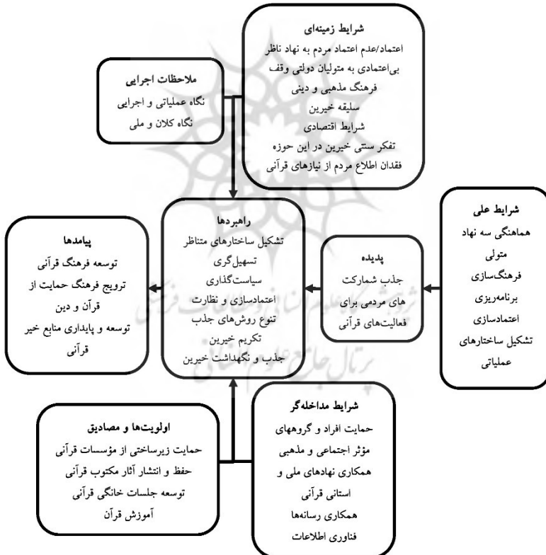
شکل (۳): الگوی جلب مشارکت های مردمی در فعالیت های قرآنی (سیدی، ۱۴۰۲)

در این راستا سیدی (۱۴۰۲) در مطالعه خود با روش تحقیق کیفی نظریه داده بنیاد با رویکرد نظام مند اشتراوس و کوربین برای بررسی موضوع جذب مشارکت استفاده شده است. مبنای مدل جذب مشارکت های مردمی برای فعالیت های قرآنی تسهیل گری نهادهای متولی از طریق راه اندازی ساختار جذب مشارکت مردمی در سازمان ها و همکاری با مجمع ملی خیرین قرآنی و واحد جذب مشارکت در مؤسسات قرآنی است. این ساختار همکارانه با اجرای راهبردهای شناسایی شده بر پایه شناخت اولویت ها و نیازها در مسیر دستیابی به هدف توسعه منابع پایدار برای فعالیت های قرآنی قرار می گیرد.