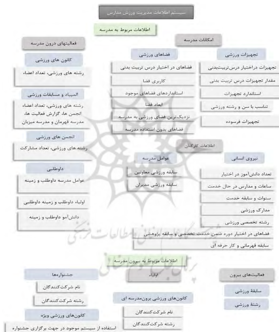
شکل ۴. سیستم اطلاعات مدیریت ورزش

در نهایت مدل پیشنهادی سیستم اطلاعات مدیریت ورزش مدارس حاصل از تجزیه و تحلیل مراحل اجرایی در شکل شماره ۴ تعیین شده است شامل سه پایگاه داده و ۱۱ زیرسیستم و ۲۸ زیر مؤلفه بود.