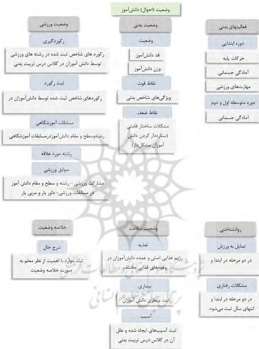
ادامه شکل ۴. سیستم اطلاعات مدیریت ورزش