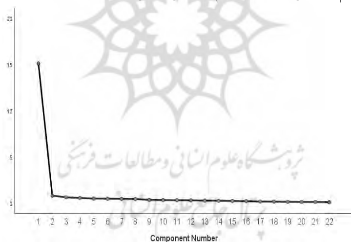
نمودار ۱. نمودار ارزش ویژه (سنگریزه)

نمودار ارزش ویژه که به نمودار یا توزیع اسکری ۱ یا سنگریزه نیز شهرت دارد، یکی از معروف ترین روش های گرافیکی برای انتخاب تعداد مناسب عامل ها در تحلیل عاملی اکتشافی می باشد. در نمودار ارزش ویژه عامل ها یا مؤلفه ها در محور افقی Y و مقادیر ویژه در محور عمودی X نشان داده می شود، طوری که همراه با حرکت به سمت راست از مقادیر ویژه نیز کاسته می شود. در این نمودار برای انتخاب تعداد عامل های مناسب، می توان هم از مقادیر ویژه بزرگ تر از یک و هم از نقطه ای استفاده کنیم که در آن، خط منحنی دچار کاهش شدید می شود. در این روش، استخراج عامل ها تا جایی ادامه داده می شود که میزان واریانس خاص از واریانس مشترک کم تر باشد، یعنی قبل از اینکه واریانس خاص از واریانس مشترک پیشی بگیرد. به عبارتی تا جایی ادامه میابد که سهم واریانس مشترک از سهم واریانس خاص بیشتر است.