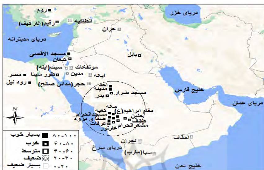
شکل ۱. نمایش سطح سواد مکان قرآنی دانشجومعلمیان بر روی نقشه جغرافیایی

از آنجایی که دانشجومعلمیان مشارکت‌کننده در این تحقیق به تازگی وارد دانشگاه فرهنگیان شده بودند و نتایج حاصل از آزمون سواد مکان قرآنی آنها به‌طور عمده می‌توانست حاصل از تحصیل در دوره دبیرستان و به‌خصوص دروس تاریخ، جامعه‌شناسی و جغرافیا باشد، به بررسی سؤال سوم در این زمینه پرداخته شد. در این رابطه، میانگین و انحراف معیار به ترتیب برای سواد مکان قرآنی دانشجومعلمیان ۶۱/۱۲ و ۱۱/۸۴؛ درس تاریخ ۱۷/۰۶ و ۲/۷۷؛ درس جغرافیا ۱۶/۳۸ و ۲/۳۹ و جامعه‌شناسی ۱۶/۲۶ و ۳/۱۲ به دست آمد (جدول ۲).