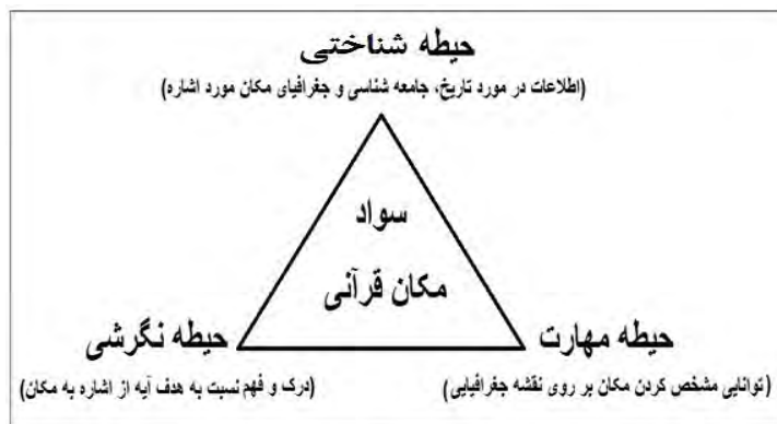
شکل ۱. نمودار حیطه‌های سه‌گانه سواد مکان جغرافیایی

با پذیرش این تعریف، بایستی برای درک مفاهیم مکانی به‌کاررفته در قرآن، از حوزه مطالعات اجتماعی نیز بهره بگیریم (شکل ۲). مطالعات اجتماعی حوزه‌ای است که مفاهیم خود را از تلفیق تاریخ، جامعه‌شناسی و جغرافیا می‌گیرد و شامل آن بخش از دانش بشری است که درباره انسان و تعامل او با محیط‌های گوناگون اجتماعی، فرهنگی، طبیعی و تحولات زندگی بشر در گذشته، حال و آینده و جنبه‌های گوناگون آن (سیاسی و اقتصادی، فرهنگی و محیطی) بحث می‌کند (فلاحیان و همکاران، ۱۳۹۱). در برنامه درسی ملی نیز حوزه‌ای تحت عنوان علوم انسانی و مطالعات اجتماعی تعریف شده که در آن بر زمینه‌سازی برای رسیدن دانش‌آموزان به درک از موقعیت و فراموقعیت در ابعاد مختلف فردی و اجتماعی تأکید شده است. قلمرو این حوزه شامل درک موقعیت و ابعاد آن در بعد زمان (گذشته، حال و آینده)، مکان (خانه، محله، شهر، کشور، زمین و کیهان)، عوامل طبیعی (محیط طبیعی و محیط زیست)، عوامل اجتماعی (ساختارها و نهادهای اجتماعی، هنجارها و رفتارها) و تعامل آن‌ها و درک چگونگی حاکمیت سنت‌های الهی بر زندگی انسان در طول تاریخ می‌شود (شورای عالی آموزش و پرورش، ۱۳۹۱).