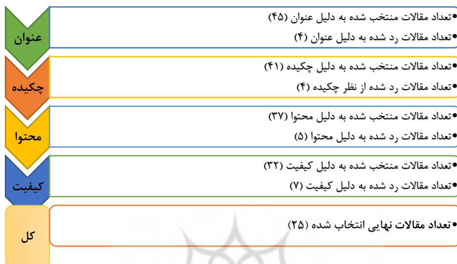
شکل ۲. روند بازبینی و انتخاب منابع مرتبط

در نهایت پس از فرآیند روند بازبینی و انتخاب منابع مرتبط ۲۵ مقاله به‌عنوان مقاله نهایی منتخب مورد استفاده قرار گرفتند. منابع استفاده‌شده برای استخراج کدها در جدول شماره ۲ نشان داده شده است.