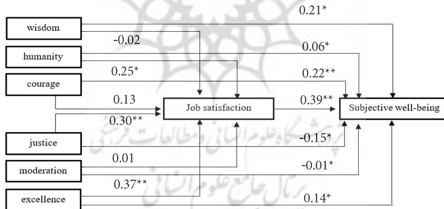
Figure 2. Final model ( P < 0.05 , P < 0.01 )

با توجه به تأیید رابطه معنی‌دار بین متغیرهای پژوهش (بهزیستی ذهنی، خشنودی شغلی و نقاط قوت شخصیت) با یکدیگر امکان بررسی نقش واسطه‌ای خشنودی شغلی در ارتباط نقاط قوت شخصیت (فضیلت‌های خرد، انسانیت، شجاعت، عدالت، اعتدال و تعالی) با بهزیستی ذهنی فراهم است. نتایج حاصل از اجرای آزمون تحلیل مسیر روش بیشینه درست‌نمایی (maximum likelihood) جهت تعیین نقش واسطه‌ای خشنودی شغلی در ارتباط نقاط قوت شخصیت (فضیلت‌های انسانیت، شجاعت، عدالت، اعتدال و تعالی) با بهزیستی ذهنی در شکل ۲ با ضرایب استاندارد و معنی‌داری ضرایب هر یک از مسیرها به نمایش درآمده است.