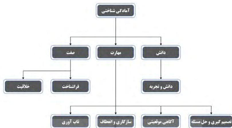
شکل ۱. مدل نهایی آمادگی شناختی

در بخش دوم پژوهش و جهت طراحی بسته آموزشی، از مدل آمادگی شناختی تدوین شده استفاده گشت و با بررسی منابع و نظر اساتید محتوا و اهداف آن مبتنی بر بافتار فرهنگی و سازمانی نظامیان ایرانی جمع آوری شد. در همین راستا، در جداول ۲ تا ۴ محتواهای بسته آموزشی آمادگی شناختی به تفکیک جلسات و مقولات آورده شده است و در نهایت ضریب نسبی روایی محتوا و شاخص روایی محتوا برای هر مورد آمده است: