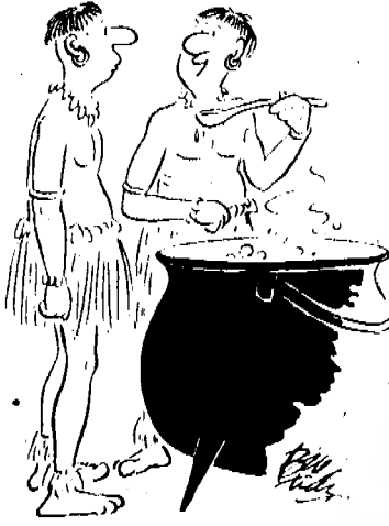
این شامل ویتامین سلامتی بدن جیم اسمیت است!

دیگر کاریکاتورست‌ها چون جیمز تورپرو بیل تیدی با تمام قدرت تلاش می‌کنند از زندگی واقعی بشر دور نشوند. اما شرحی که در زیر تصاویر می‌نویسند عجیب به دور از واقعیت است و تنها از ذهن و اندیشه آنها نشات می‌گیرد. او کاریکاتورست هنرمند تعلیم ندیده‌ای است که آن خطوط ناهنجار و زشت گویای نوع شخصیت و خلق و خوی وی است. بیل تیدی تعلیم آموزش رسمی ندیده و کاملاً تجربی کار کرده است و دارای استعداد ذاتی است. به نظر می‌رسد او قادر است هر چیز و هر کسی را بکشد وی ذهنی قوی و زایا دارد. او یک بار در مورد مشکلات دورنما گفت: «دورنما چیزی است که شما می‌بینید، بنابراین مشکل چیست؟ اگر شما نمی‌توانید