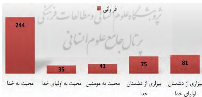
نمودار ۲- فراوانی هر یک از مؤلفه‌های عاطفه دینی در کتاب‌ها

اطلاعات نمودار شماره (۱) نشان می‌دهد که کتاب پیام‌های آسمان پایه نهم بیشترین فراوانی مؤلفه‌های دینی را دارد. مؤلفه‌های عاطفه دینی در این کتاب ۱۷۱ بار تکرار شده و در دو کتاب دیگر (پایه هفتم و هشتم) به ترتیب ۱۶۶ و ۱۴۷ مورد آمده است.