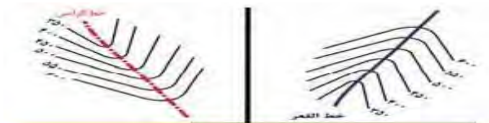
شکل ۹: نمایش دره و پشته با ترسیم منحنی میزان

رنگ، ضخامت خط و چگونگی نوشتن اعداد بر روی این خطوط از ویژگی‌های مهم هنری هستند که در کارآمدی و تصویر دقیق پدیده در ذهن فراگیران موثر می‌باشد. شکل منحنی میزان: دره‌ها و آبراهه‌ها نسبت به سربالایی در منحنی میزان به شکل عدد ۸ و یال‌ها و پشته‌ها به شکل عدد ۷ دیده می‌شوند. به عبارت دیگر، منحنی‌های تراز به طرف داخل دره‌ها و آبراهه‌ها تورفتگی ترسیم می‌کنند و برعکس، در پشته‌ها و میاناب‌ها حالت برآمدگی نشان می‌دهند، (یمانی ۱۳۹۵: ۱۴۹).