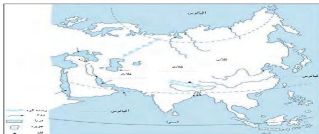
شکل ۱۱: نقشه گنگ آسیا برای فعالیت فراگیران

به طور مثال از فراگیران خواسته شود در نقشه آسیا، علاوه بر اینکه نام مکان‌های خواسته شده را بنویسند، دشت‌ها و جلگه‌ها، کوه‌ها، رودخانه‌ها، قله و جزایر مهم آسیا را با علائم قراردادی که فرا گرفته‌اند، مشخص نموده و به منطبق سواد هنری، به نحو جذاب و منطبق بر اصول حاکم بر پدیده‌های جغرافیایی، رنگ‌آمیزی نمایند.