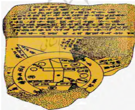
شکل ۱: لوح گلی باقی مانده از گل رس (گروه مولفان، ۱۳۹۳: ۳۴)

علاوه بر این، استفاده از نقشه در فراگیری مطالب عمومی و علمی از قدیم الایام تا به امروز، همواره در بین مردم رایج بوده و به شکل‌های مختلفی انجام می‌شده است. به عنوان مثال، مردمان نخستین براساس تصورات ذهنی، محدوده محل زندگی خود را تصور می‌کرده‌اند. این نوعی «نقشه ذهنی» است. اما، هیچ کس به درستی نمی‌داند که نخستین نقشه چه زمانی و توسط چه کسی تهیه شده است. بنابر نتایج تحقیقات باستان‌شناسی که از حفاری‌های مختلف در مناطق گوناگون به دست آمده است، این احتمال وجود دارد که قدیمی‌ترین نقشه معتبر، باقی مانده لوحی از گل رس است که در بابل کشف شده است (شکل زیر).