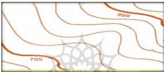
شکل ۸: ضخامت و اعداد مندرج بر روی منحنی تراز

خطوط تراز فرعی: منحنی‌هایی هستند که روی نقشه کم‌رنگ‌تر و باریک‌تر از منحنی‌های میزان اصلی ترسیم شده‌اند. بین هر دو منحنی میزان اصلی چهار منحنی واسطه وجود دارد که البته ارتفاع مربوط به هر یک روی آن‌ها درج نشده و ارتفاع آن‌ها را باید از روی منحنی میزان‌های اصلی به دست آورد.