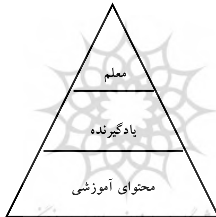
نمودار ۱: عناصر مهم آموزش (نگارنده)

آموزش و تربیت از جمله الزاماتی است که با شروع زندگی اجتماعی در جوامع انسانی شکل گرفته است و امروزه به صورت یکی از ارکان اساسی رشد و توسعه پایدار در جوامع مختلف درآمده است؛ تا جاییکه که اغلب صاحب‌نظران بر این عقیده‌اند که اگر نظام آموزش و پرورش به نحو صحیح و مناسبی اجرا شود؛ می‌توان بر بسیاری از مشکلات فائق آمده و جامعه را به سوی پیشرفت و تعالی در جنبه‌های مختلف (توسعه پایدار) سوق داد. بی‌شک، فرآیند تعلیم و تربیت از ارکان و عوامل متعدد و متنوعی برخوردار است که هر کدام در پیشبرد اهداف و موفقیت آن اثرگذار هستند. مهمترین اجزاء اثرگذار در آموزش را می‌توان به سه بخش تقسیم کرد. به عبارت دیگر وظیفه و بار اصلی امر آموزش بر عهده این سه بخش می‌باشد که عبارتند از: