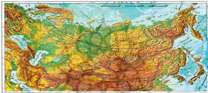
شکل ۶: نمایش ناهمواری ها به وسیله رنگ در نقشه

د) رنگ سبز برای نمایش زمین‌های حاصلخیز و رنگ خاکستری برای زمین‌های بایر؛