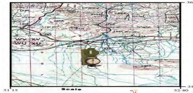
شکل ۵: نقشه توپوگرافی شهر گرمسار

ب) رنگ سیاه برای نمایش سازه‌های دست انسان، مثل خانه، مدرسه، مسجد، جاده و غیره؛