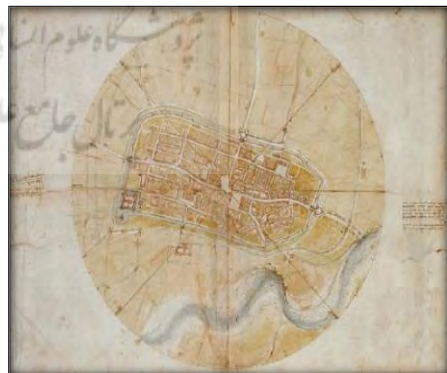
شکل ۲: نقشه‌های قدیمی مبتنی بر دانش هندسی