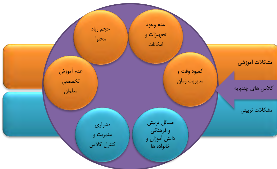
شکل ۱: مشکلات اصلی آموزشی و تربیتی کلاس های چندپایه از دید معلمان

می باشد. همچنین کوچک بودن فضای کلاس از جهت قرار گرفتن دانش آموزان پایه های مختلف در کنار هم عامل ایجاد مشکل تمرکز در دانش آموزان عنوان شده است.