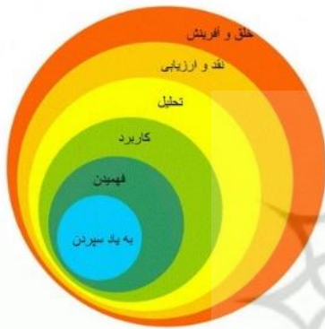
شکل ۱: مفهوم نظری

از آنجایی که به تدریج استفاده از تکنولوژی آموزشی در مراکز آموزشی در دوره کرونا در بین دانش‌آموزان رو به افزایش است و این مشکلات اگر به موقع تشخیص داده نشوند، می‌توانند پیامدهای منفی بسیاری برای آموزش و پرورش چه در زمان حال و چه در زمان آینده به وجود آورند، پژوهشگر در پژوهش حاضر به دنبال بررسی رابطه‌ی تکنولوژی آموزشی در آموزش انفرادی دیدگاه بوم در کتاب سبک تفکر و زندگی جدید التالیف دوره‌ی اول متوسطه پایه‌ی هفتم در منطقه رودهن در دوره کرونا است تا بتوان از این طریق به راهبردهایی دست یافت و از آنها در مراکز آموزشی، پژوهشی در دوره کرونا بهره‌برد و بهداشت روانی و اعتماد بنفس دانش‌آموزان را ارتقا بخشید.