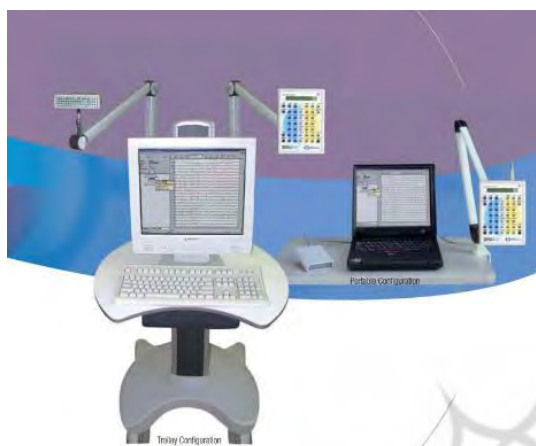
شکل ۱. دستگاه الکتروانسفالوگرافی مدل Scan-LT کمپانی Neuroscan آمریکا

نهایت هر دو گروه، الگوی ترکیبی و همزمان بینایی - شنیداری را مشاهده کردند. زمان مشاهده فیلم الگوی بینایی و بینایی- شنیداری و همچنین الگوی شنیداری به صورت برابر و معادل ۲ دقیقه در نظر گرفته شد. با توجه فعال سازی نورون‌های آینه‌ای هنگام تصویرسازی، از شرکت کنندگان خواسته شد که در مرحله استراحت به صفحه سفید مانیتور نگاه کنند.