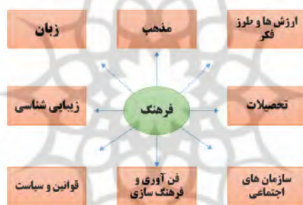
شکل ۲- عوامل تشکیل دهنده فرهنگ