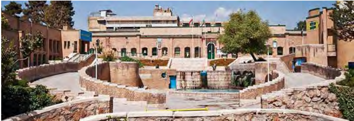
شکل ۳- فرهنگسرای شفق