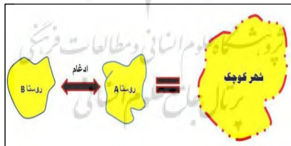
شکل ۲. روند تبدیل روستا به شهر از طریق ادغام

تبدیل روستاها به شهر و از طریق آن ایجاد شهرهای کوچک همواره به عنوان یکی از مهم‌ترین سیاست‌ها در موضوع برنامه‌ریزی کشورهای در حال توسعه بوده است؛ یکی از اهداف اصلی این سیاست، حضور و نفوذ بیشتر در روستاهاست زیرا هر چند پایه‌های اقتصادی دولت تا پیش از اصلاحات ارضی، بر اقتصاد کشاورزی با ساختار روستایی استوار بود، اما