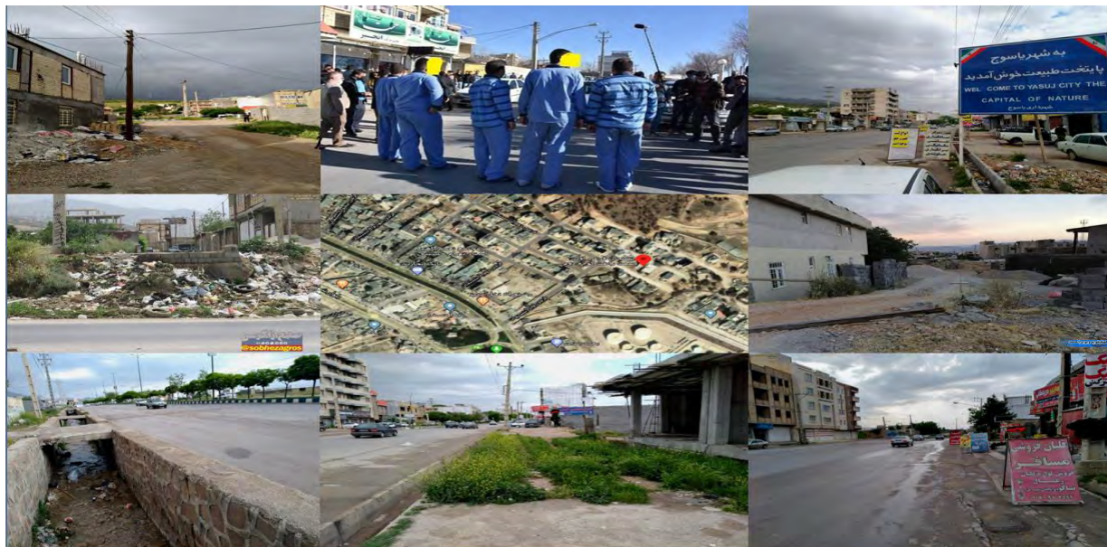
شکل ۲: نمایی از وضعیت بافت کالبدی و اجتماعی محله بنسجان