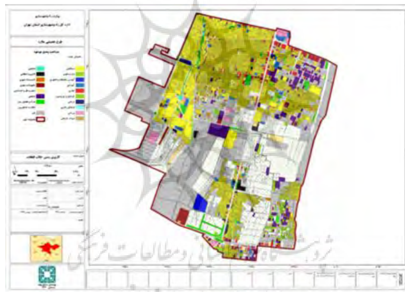
نقشه ۲: کاربری غالب زمین در وضع موجود در شهر ملارد

۱۶۴۶۰ نفر در سال ۱۳۶۵ بالغ شد. رشد انفجاری جمعیت طی دهه بعد، تا حدی پیش رفت که به‌طور متوسط در هر سال، \frac{19}{8} درصد به جمعیت شهر اضافه‌شده و تا سال ۱۳۷۵، جمعیت شهر ملارد به حدود ۱۰۰۲۳۰ نفر رسید که نشانگر \frac{6}{1} برابر شدن جمعیت نسبت به سال ۱۳۶۵ است. جمعیت شهر در سال ۱۳۸۵، با رشد سالانه \frac{8}{6} درصد به ۲۲۸۷۱۳ رسید که حدود \frac{2}{3} برابر نسبت به سال ۱۳۷۵،