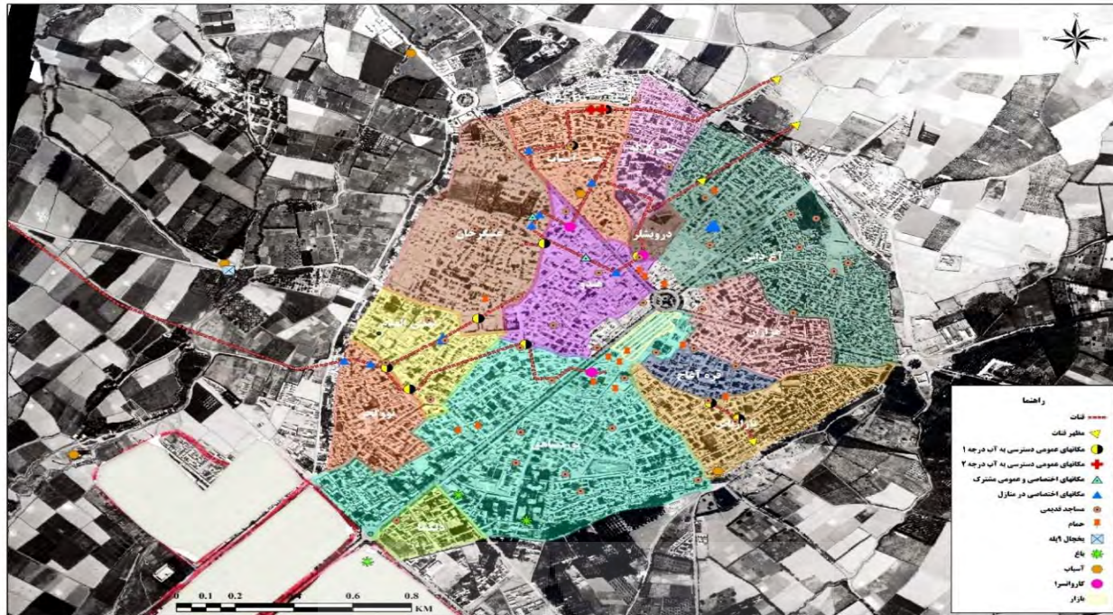
شکل ۳ نظام کارکردی گردش آب (سیستم پایگان آب) در شهر ارومیه لازم به ذکر است عنصر معماری و شهرسازی مرتبط با آب و نظام گردش آب بر روی نقشه هوایی ۱۳۳۵ مکان‌یابی شده‌اند.

پیشخان، فواره و گاه جوی آب ارتباط نزدیک داشته است (سلطانی محمدی و یوسفی، ۲۰۱۹: ۱۰۷).