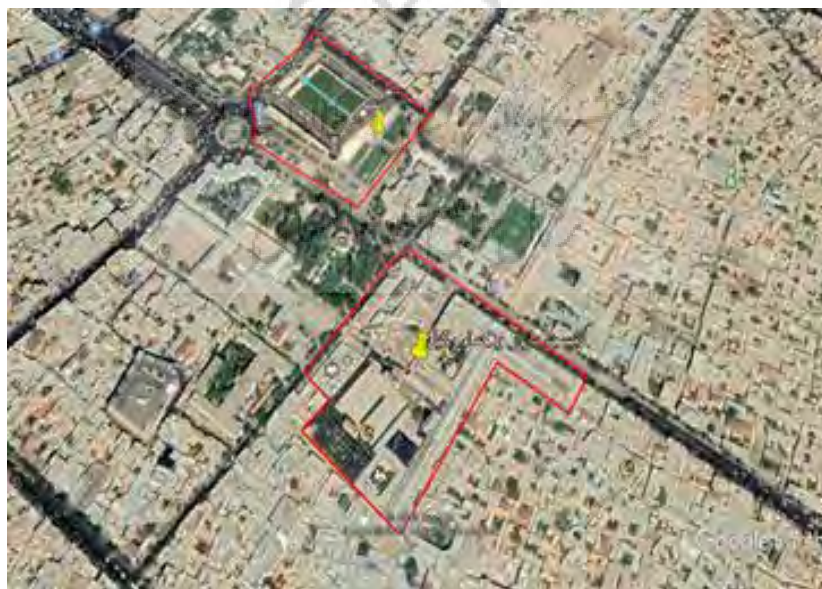
شکل ۴ محدوده مجموعه شاهچراغ

مجموعه حرم حضرت شاهچراغ که شیراز را بعنوان سومین حرم اهل بیت معرفی کرده و از