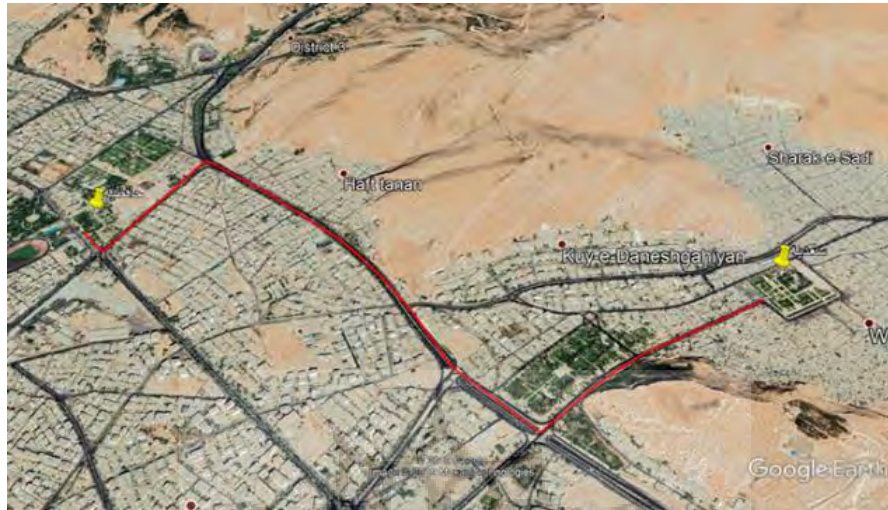
شکل ۱ محور حافظیه تا سعدیه

۱) محور حافظیه تا سعدیه آرامگاه دو شاعر نامی با شهرت جهانی بطول ۳,۳ کیلومتر (شکل ۱)