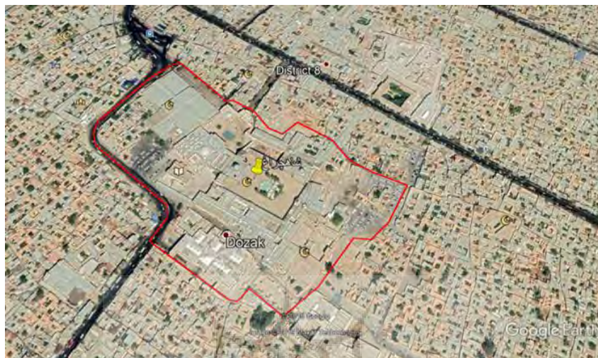
شکل ۳ محدوده مجموعه زندیه

محدوده مجموعه زندیه شامل ارگ کریم خان بازار، حمام و مسجد وکیل آثار تاریخی شاخص از