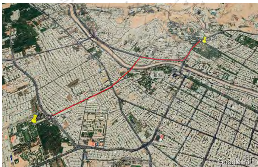
شکل ۲ محور باغ ارم تا باغ عفیف آباد

۲) محور باغ عفیف آباد تا باغ ارم دو باغ کلاسیک با سازماندهی منحصر بفرد و شهرت ملی با پتانسیل بالای اکولوژیکی بطول ۳,۱ کیلومتر (شکل ۲)