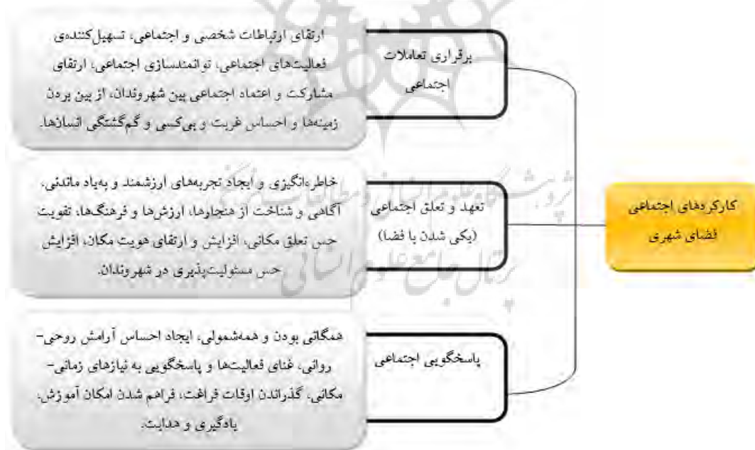
شکل ۱ مدل مفهومی تحقیق (مطلوبیت کارکردهای اجتماعی فضای شهری)

پژوهش به صورت موردی در مرکز شهر مکزیکوسیتی انجام شده و قوانین و مقررات تعیین‌شده توسط دولت مکزیکوسیتی که استفاده از خیابان را تنظیم می‌کند، مورد بررسی قرار داده است. نتایج پژوهش نشان می‌دهد که بین عدم وضوح در قانون مربوط به فعالیت‌ها و عملکردهای احتمالی در خیابان و یک اجماع ظاهراً ضمنی بین شهروندان در مورد چگونگی مناسب بودن چنین فضاهای عمومی، اختلاف نظر وجود دارد. این تضاد در کارکردهای فضاهای عمومی به شیوه‌های سنتی و جدید مشهود می‌باشد. کائو و کانگ ۱ (۲۰۱۹)، در تحقیق خود روابط اجتماعی و الگوهای استفاده‌شده در فضاهای عمومی شهری در چین و انگلستان را مورد مطالعه قرار داده‌اند. این تحقیق سه نوع روابط اجتماعی را در فضاهای عمومی تعریف می‌کند: جفت صمیمی، گروه صمیمی و گروه اجتماعی. جفت‌های صمیمی و گروه‌های صمیمی در موارد زیاد در حال صحبت و نشستن و استفاده از امکانات