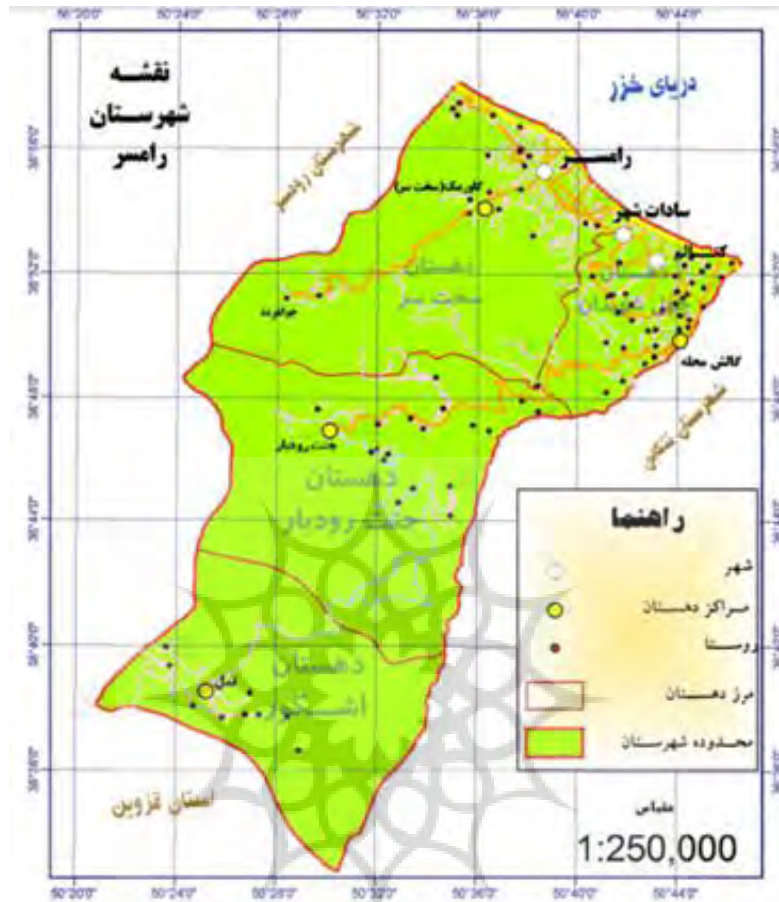
شکل ۱ موقعیت شهرستان رامسر

بود. از این سال به بعد تغییرات مهمی در آن صورت گرفت و هم‌اکنون این شهر تاریخی از بهترین