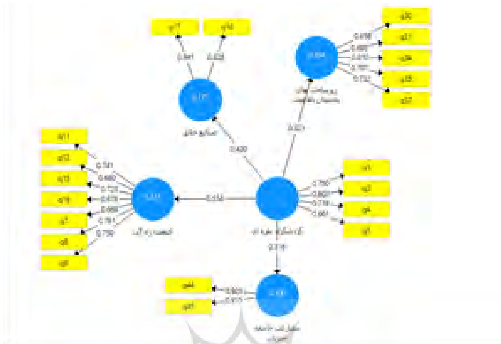
شکل ۲ ضرایب ساختاری مدل